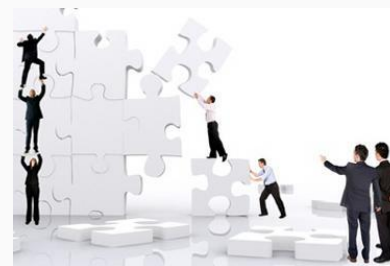
Imprenditorialità e autoimprenditorialità