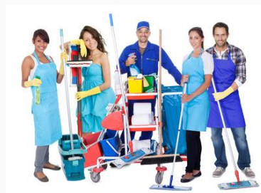
Impresa di pulizie