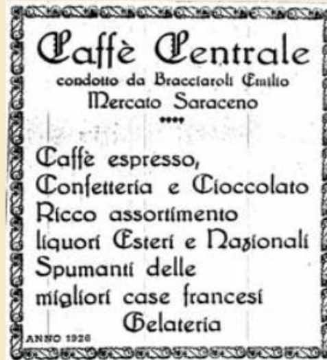
Publicazione della guida Touring del 1926

Indirizzo Via Mazzini, 52 - 47025 Mercato Saraceno (FC) Tel. 0547 690084 E-mail c.bracciaroli@ascom-cesena.it