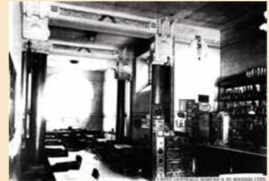
Interno del locale nel 1926