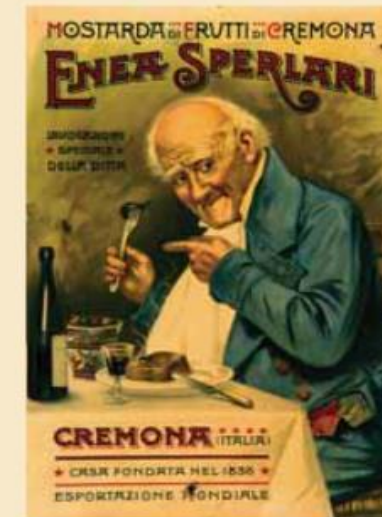
Latta anni Trenta della Enea Sperlari