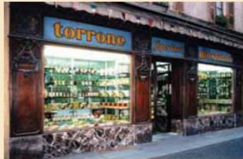
Esterno del negozio Sperlari dal 1836

Indirizzo Via Solferino, 25 - 26100 Cremona (CR) Tel. 0372 22346 Fax 0372 33644 Sito www.sperlari1836.com E-mail info@sperlari1836.com