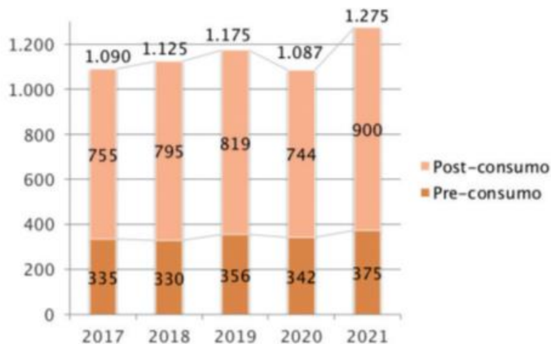
Figura 1 - Impiego di riciclati plastici nella trasformazione italiana

Ciascuno di questi processi produttivi genera una quantità di ritagli o sfridi , generalmente ben nota e correlata alla tecnologia di trasformazione. Ciò fa sì che la proporzione tra riciclati post consumo e riciclati pre-consumo impiegati dall'industria della trasformazione si mantenga in linea di massima costante . Ciò è ben evidente nel grafico sottostante (fa eccezione il 2020, fortemente influenzato dalla crisi pandemica).