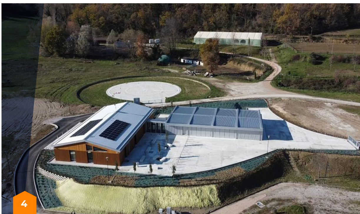
Costruzione del Centro polifunzionale di Protezione Civile a Comunanza (AP)

MC: La nomina del dott. Giovanni Legnini a commissario delegato ha sicuramente dato nuovo slancio alle attività pubbliche di ricostruzione nel periodo 2020-2023, e confidiamo nel fatto che il nuovo Commissario il Sen. Guido Castelli proeguirà tale trend positivo. In quanto Società Nazionale di Croce Rossa, non essendo un ente pubblico amministrativo, non abbiamo potuto beneficiare, almeno fino ad oggi, degli speciali poteri derogatori. Tuttavia, con l'Ordinanza Speciale 19 del 15 luglio 2021 del Commissario Straordinario, per gli importanti risultati conseguiti, la Croce Rossa Italiana è stata nominata per la prima volta 'soggetto attuatore' per la realizzazione di un centro sportivo polifunzionale ad Arquata del Tronto). Si tratta di un riconoscimento importante del lavoro svolto, che ci dà grandi responsabilità, oltre all'opportunità di testare sul campo l'efficacia dei cosiddetti "poteri speciali". Oggi, avendo aggiudicato la procedura di gara in soli cinque mesi (con l'inconveniente di una prima fase andata "deserta") riteniamo di aver ben adempiuto all'incarico conferito, oltre che di poter confermare l'efficacia delle deroghe concesse dal Commissario.