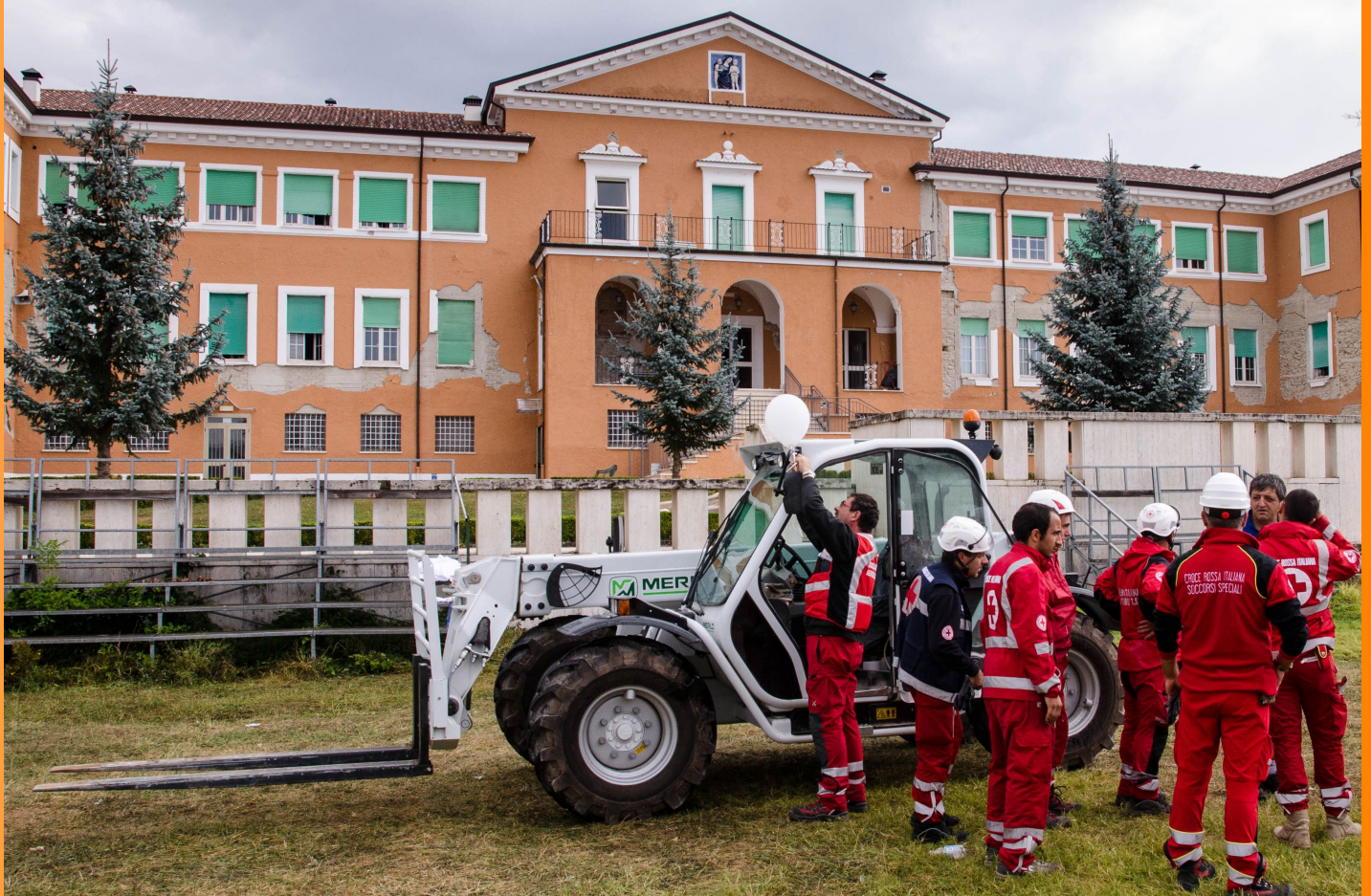
Volontari e personale della Croce Rossa Italiana impegnati nella fase di ripresa post-terremoto, a fianco della popolazione di Amatrice (Lazio)

La realizzazione di un modello di governance ad hoc può così favorire una maggiore adattabilità di tali processi alle specificità e alle istanze espresse da parte delle comunità coinvolte, anche grazie ad accordi e partnership tra le amministrazioni pubbliche e i principali portatori di interesse come i privati o le categorie tecniche e professionali.