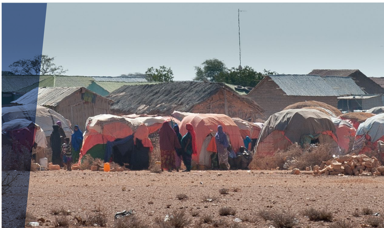
Un campo per sfollati interni sorto vicino al villaggio di Tukaraq nella regione di Sool (Somalia)

Altri strumenti internazionali giuridicamente non vincolanti, ma comunque in grado di esercitare 'effetti normativi' sugli attori coinvolti (c.d. soft law ) rappresentano un punto di riferimento importante. Oltre alla Sendai Framework di cui si è dato conto, tra questi si possono annoverare le risoluzioni approvate nel corso degli anni da parte dell'Assemblea Generale dell'ONU, la cui prima e poi importante in materia (UNGA Ris. 46/182 del 1991) ha stabilito come già nella fase emergenziale post-catastrofe si dovessero considerare le ricadute in termini di riabilitazione e ricostruzione successive, con un occhio allo sviluppo futuro (paragrafi 9, 40, 41).