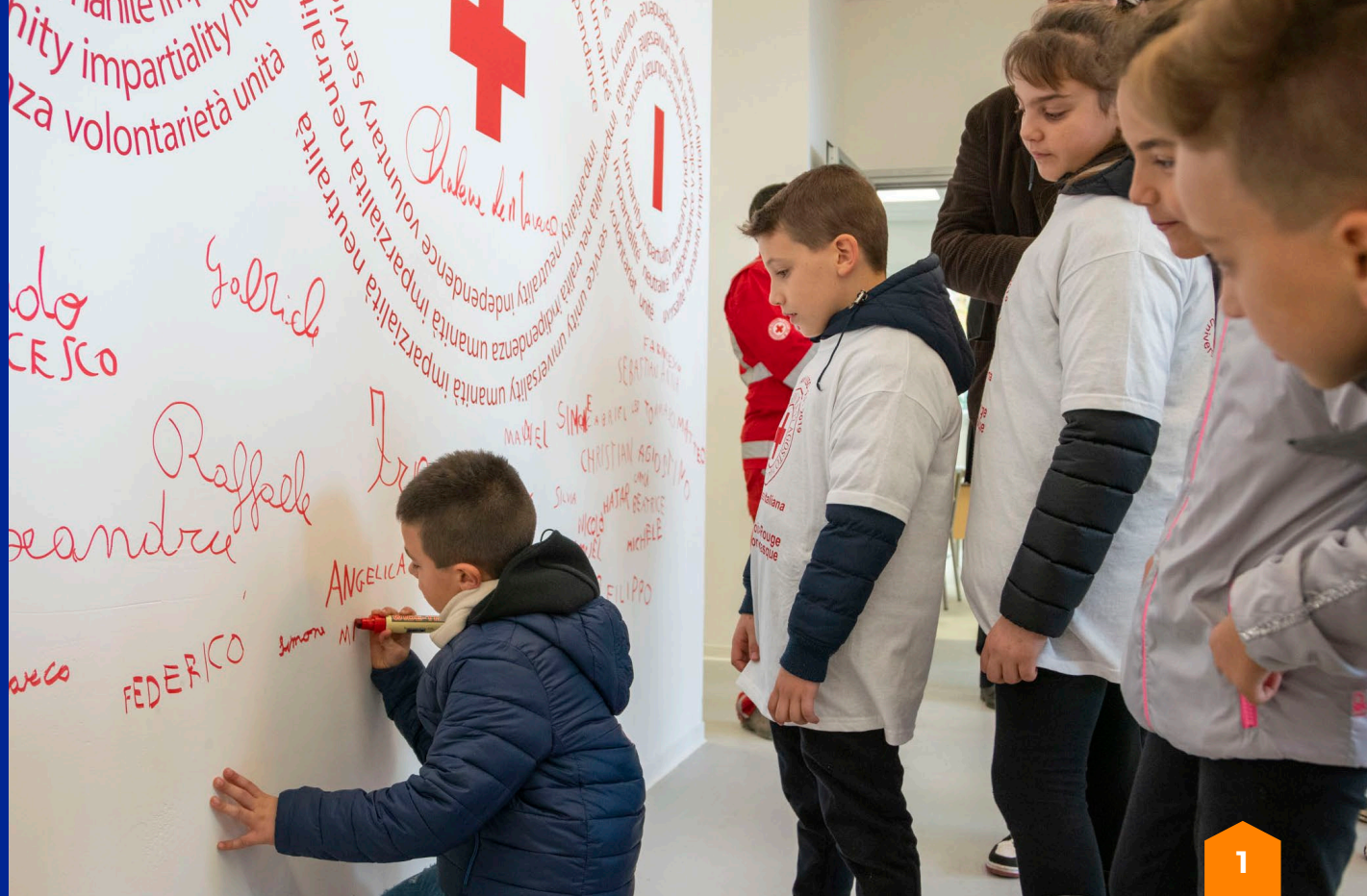
Riapertura della scuola elementare di Isola del Gran Sasso d'Italia