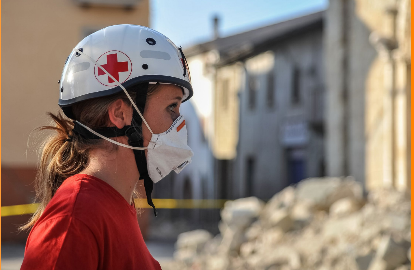
Una volontaria della Croce Rossa Italiana

Ripresa e Resilienza (PNRR) approvato nel 2021 e finanziato dall'UE al fine di rilanciare il Paese a seguito della pandemia di Covid-19, è stato destinato un Fondo complementare aggiuntivo rispetto alle risorse già stanziato per la ricostruzione pubblica e privata, destinato a tutte le aree del Centro Italia colpite dagli eventi sismici negli ultimi anni, e da attuare entro dicembre 2026. 41