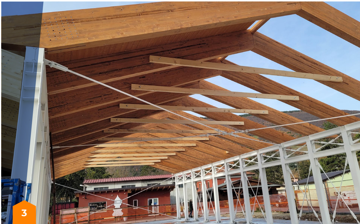
Centro polifunzionale di Muccia, comprensivo di una biblioteca, spazi polivalenti finalizzati all'aggregazione sociale e alla fornitura di servizi ambulatoriali.

Questi ci hanno aiutato a ottimizzare, snellire e velocizzare il nostro lavoro, con risultati molto soddisfacenti rispetto agli obiettivi precedenti. Resta il rammarico per il ritardo accumulato in fase progettuale, anche se, rispetto al quadro generale della ricostruzione, le nostre tempistiche appaiono più veloci della media dei lavori pubblici. Anzi, è quasi assimilabile a quelli della ricostruzione privata, soprattutto considerando che queste ultime operano al di fuori delle disposizioni normative del D.lgs 50/2016. Da questo punto di vista, i risultati in termini di lavori realizzati in sei anni sono molto significativi.