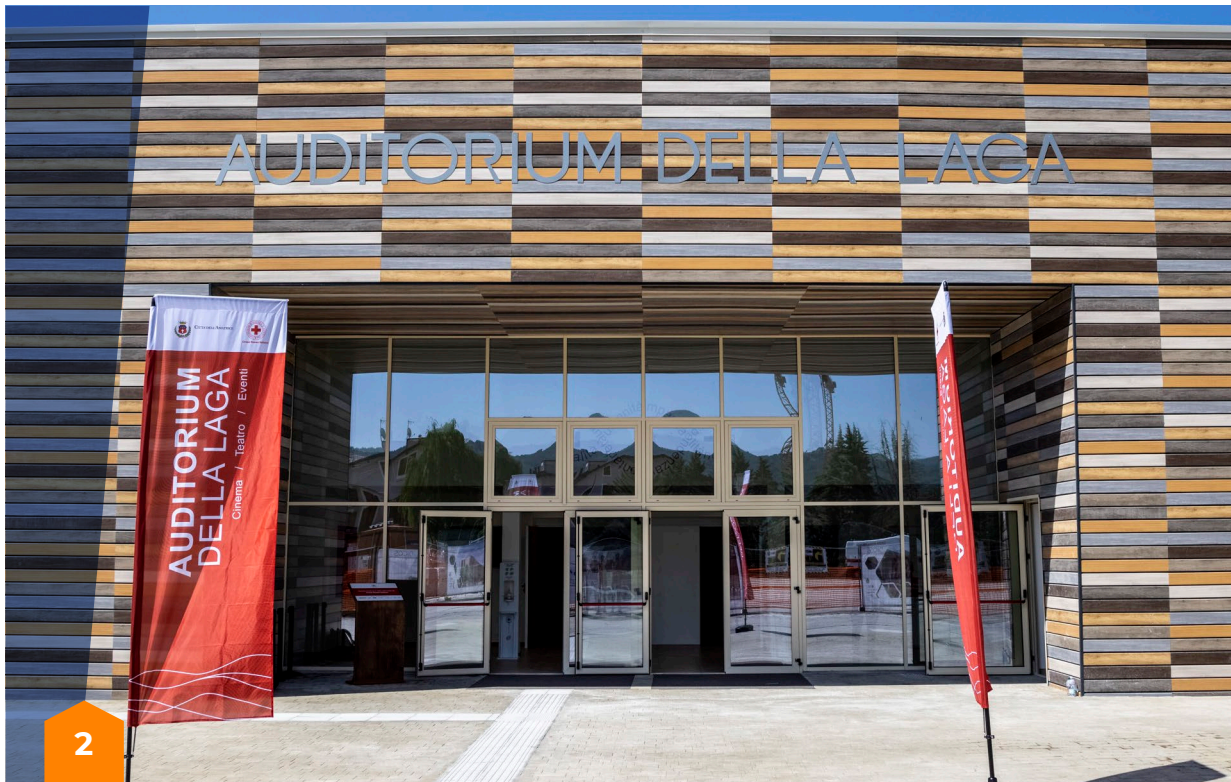
Auditorium realizzato nel Centro polifunzionale di Amatrice, finalizzato a creare un luogo di cultura, scambio e formazione dove ritrovarsi come comunità

nelle quattro regioni colpite. Cosa ha comportato dover operare in un modello di governance complesso e multilivello come quello previsto dal DL 189/2016? Puoi farci degli esempi?