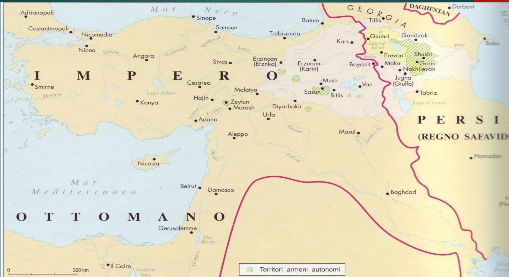
Carta 23. XVII secolo: dopo il trattato di pace turco-persiano (1639)