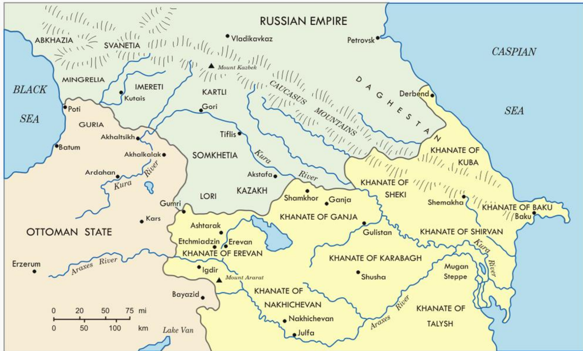
Transcaucasia in the early XIX century