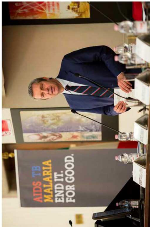
Sotto Segretario Benedetto Della Vedova, Ministero degli Esteri, annuncia il contributo Italiano il 27 Giugno 2016