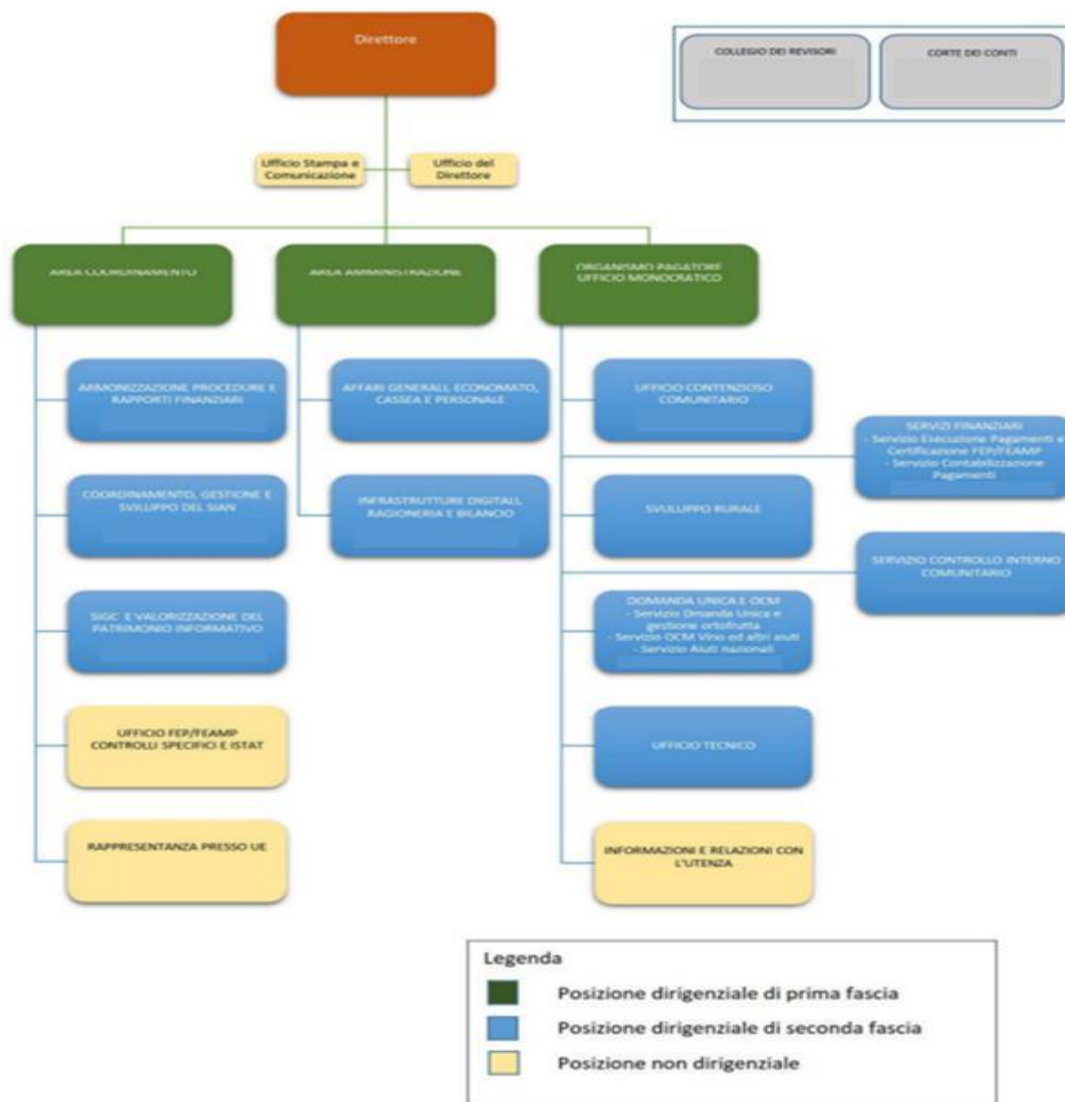
Figura 1 - Organigramma

La configurazione del modulo organizzativo di AGEA viene evidenziata nella seguente figura.