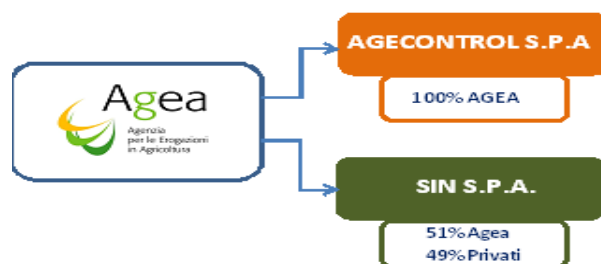
Figura 2 - Le partecipazioni di AGEA 2021

Come già rilevato al capitolo 1, tale assetto era stato modificato in maniera sostanziale dal decreto legislativo n. 74 del 2018, nonché ulteriormente modificato e integrato dal decreto legislativo n. 116 del 2019.