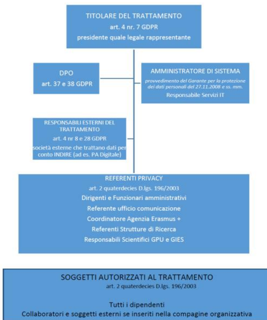
Figura 2 - Organigramma privacy

Nell'esercizio 2020, con delibera del Consiglio di amministrazione del 24 marzo 2020, l'Ente ha adottato un proprio organigramma privacy , riportato nella figura che segue.