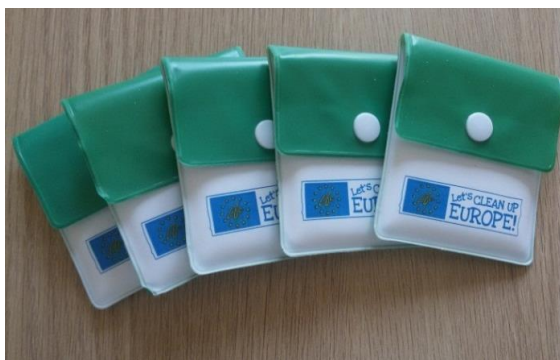
La borraccia e i porta-cenere di LCUE

Inoltre, è stata creata la bandiera di LCUE, inviata ai Coordinatori Nazionali e agli Action Developer assieme ai poster di LCUE (foto pagina seguente).