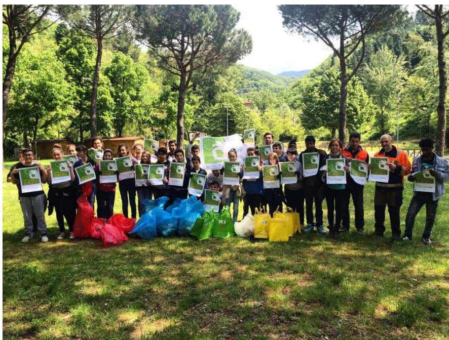
Comune di Londa, Firenze.