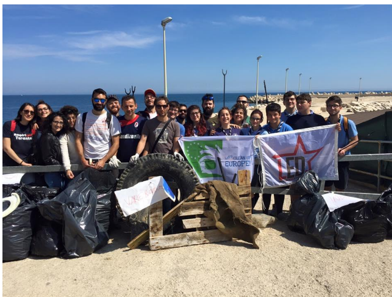
Associazione LED Giovinazzo, Bari