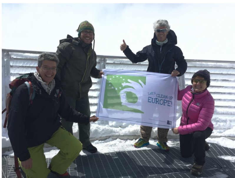
Punta Helbronner, Massiccio del Monte Bianco