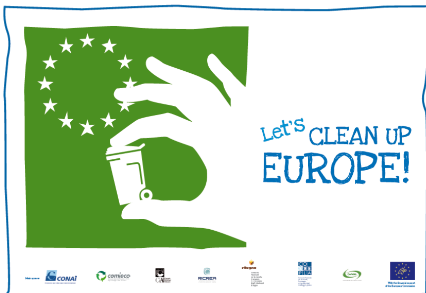
La bandiera LCUE in versione italiana con i loghi degli sponsor