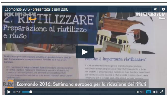
Servizio sulla Conferenza Stampa di lancio nazionale della SERR ad Ecomondo

ECOMONDO 2016 - RIDUCI, RIUSA, RICICLA: PRESENTATA L'EDIZIONE 2016 DELLA SERR