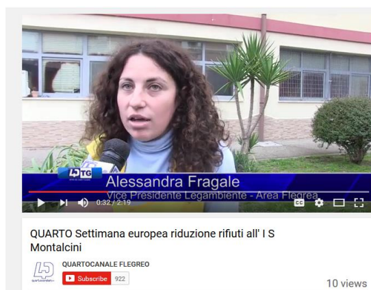
Quarto Canale Flegreo, 25 novembre

Ci sono anche stati passaggi sulle tv locali ; di seguito alcuni screenshot a titolo di esempio: