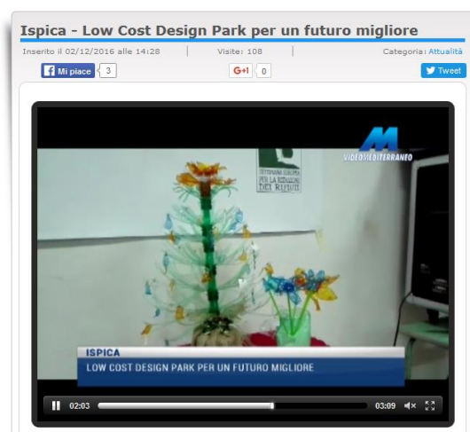
Video Mediterraneo, 2 dicembre