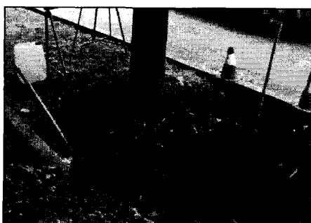
Problemi di cantiere: esempio di interferenza tra apparati radicali e servizi