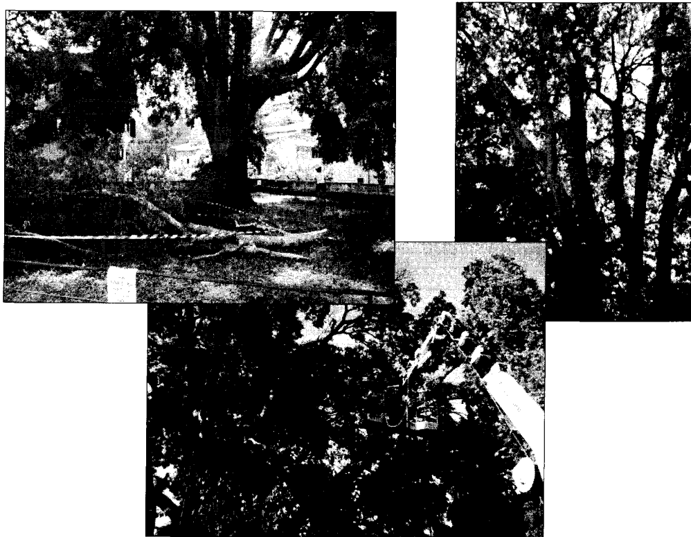
Bagolaro monumentale cui ha ceduto una branca per presenza di carie; il valore dell'albero ha indirizzato la scelta su un intervento di potatura di contenimento e risanamento, consolidamento in quota e arieggiamento del terreno.