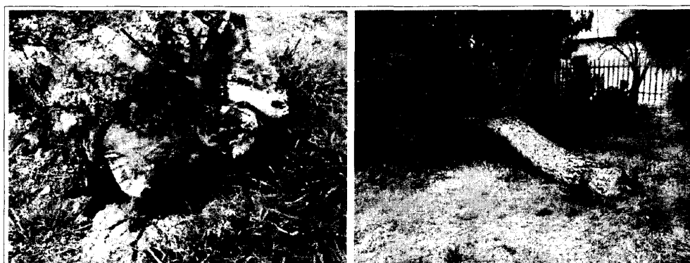
Pino domestico abbattuto dal vento: Notare l'assenza di contrafforti radicali che dal colletto si estendono verso il terreno ad unire il fusto con le radici principali, che sono malformate ed addirittura assenti a causa della strazzatura provocata dallo sviluppo delle radici avvolgenti sviluppatesi nei vasi in vivaio.

L'intera "struttura albero" è sottoposta a sollecitazioni statiche e dinamiche di tipo e origine diversi (peso proprio, vento, neve, ghiaccio). Il peso proprio e il carico di neve o di ghiaccio danno luogo a sollecitazioni statiche e quindi sono responsabili di cadute solo in caso di eventi eccezionali. Tra le sollecitazioni dinamiche, quelle dovute al vento sono, senza dubbio, le più importanti, soprattutto perché possono presentarsi con una particolare intensità e determinare la rottura del fusto e/o di grosse branche o il ribaltamento dell'albero stesso.