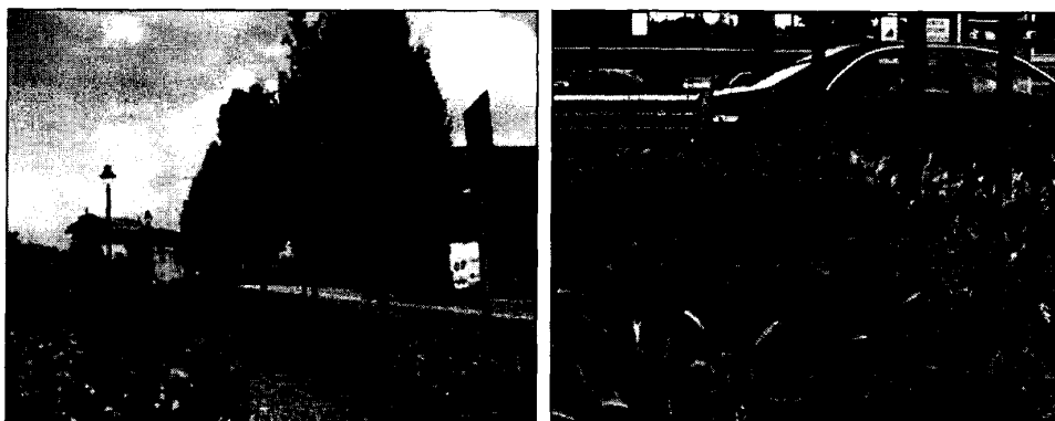
Buone pratiche ed alternative alle formazioni erbacee, tipo i wild flowers