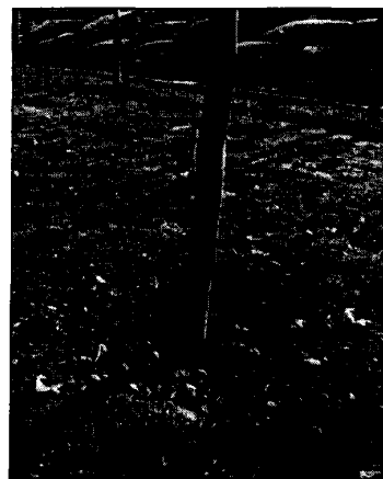
Errata messa a dimora con colletto sotterrato