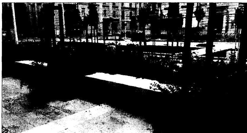
La specie giusta al posto giusto può ridurre i costi di gestione

La progettazione di aree dotate di questo tipo di vegetazione deve evitare che le specie utilizzate possano arrecare problemi di ordine pubblico limitando la visibilità, o creando siti di occultamento di persone o cose; in aree verdi attrezzate o destinate ad attività di svago va inoltre evitato il ricorso a specie potenzialmente