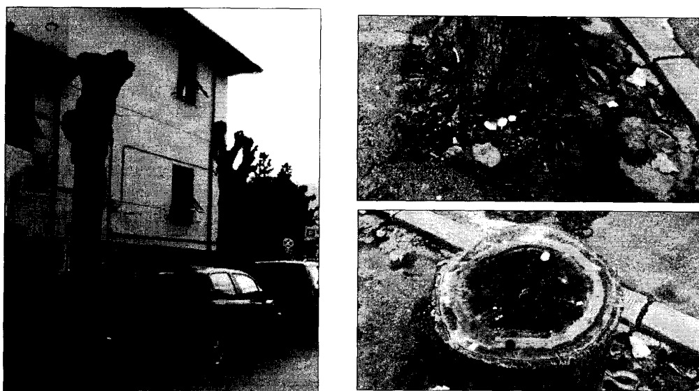
Continue capitozzature, asfalto e compattazione del terreno stanno provocando la morte di un viale di tigli