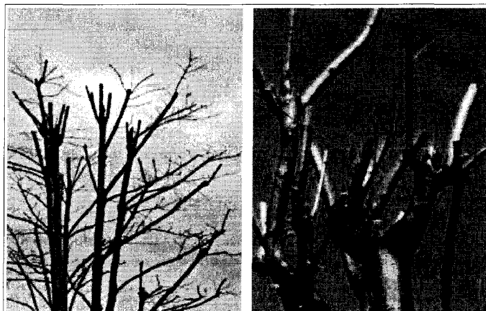
Una potatura senza criterio porta alla disorganizzazione completa della ramificazione; può provocare forti reazioni vegetative e quindi non serve a ridurre le dimensioni della chioma

Tempistica, periodo, intensità dell'intervento dovranno essere contestualizzati alle caratteristiche stagionali e vegetazionali.