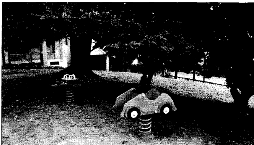
Errata scelta botanica per area giochi: i semi di Taxus baccata sono velenosi

Per quanto riguarda la componente vegetale , essa riveste un ruolo importante nel fornire uno spazio di gioco piacevole e attrattivo, non solo per i piccoli, ma anche per i grandi che li accompagnano. Le piante possono inoltre stimolare il gioco e l'apprendimento all'aria aperta: i bambini sono attratti dalla natura e dal verde ed hanno il diritto di familiarizzare con gli esseri viventi che li circondano. Le piante dovranno quindi essere parte integrante di ogni area gioco, ma la scelta delle specie dovrà tenere in massima considerazione il fatto che i bambini giocheranno con la vegetazione manipolandola (ad esempio evitare in fase di progettazione specie vegetali con parti velenose o con parti che possono provocare ferite, come spine o foglie taglienti).