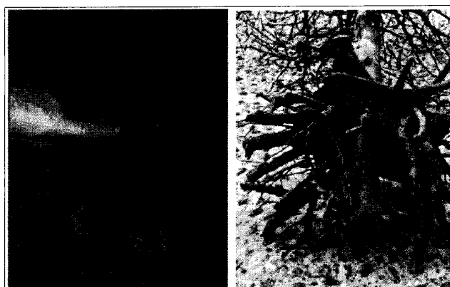
A sinistra, apparato radicale fascicolato a seguito di corrette zollature; a destra, apparato radicale con caratteristiche inadeguate, a causa di mancate lavorazioni in vivaio e zollatura tardiva