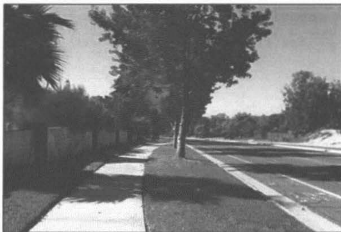
Un esempio di Green way, modello ottimale per le alberature stradali

Anche la rinaturalizzazione dei marciapiedi di maggior estensione rappresenta una forma di notevole miglioramento dell'estetica e della funzionalità ecologica della città.