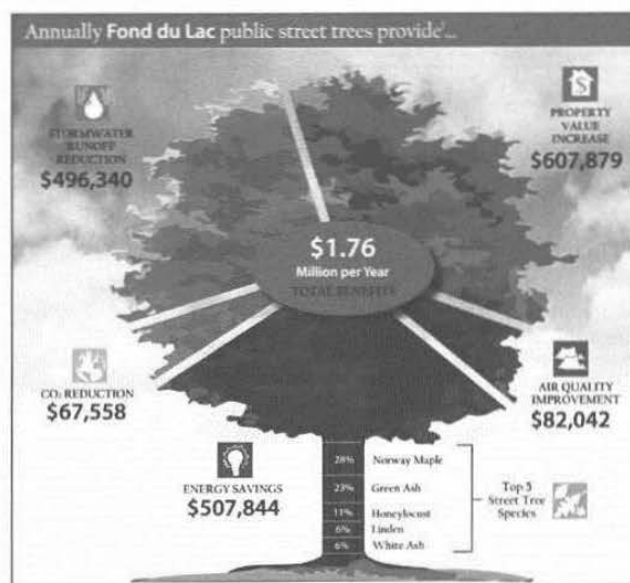
Figura 6.3. Esempio di stima economica dei benefici forniti dal verde alla cittadina di Fond du Lac, calcolati con le funzioni di i-Tree