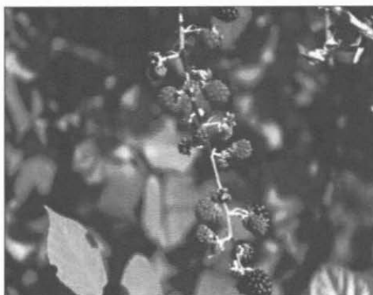
More di Rovo, specie arbustiva spontanea nelle aree urbane ad elevato valore ecosistemico

Ricordiamo i numerosi e importanti servizi di base e accessori che il verde naturale reca ai cittadini, il valore socio-culturale delle aree verdi ed il patrimonio naturale e di biodiversità che si sta perdendo/degradando e del quale il pubblico non può fruire.