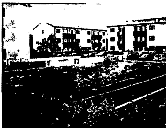
Impianto di fitodepurazione al servizio di 180 abitanti equivalenti in Provincia di Treviso