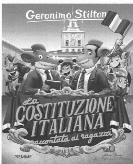
Distribuzione copie "La Costituzione raccontata ai ragazzi" per tipologia di destinatario

Alle scuole in particolare abbiamo chiesto di inviarci, alla fine del percorso didattico nato a partire dalla lettura di questa pubblicazione e delle parole chiave contenute, una piccola testimonianza di quanto fatto da e con i ragazzi. Abbiamo anche suggerito alle scuole con cui siamo entrati più direttamente in contatto, di fare in modo che questo libricino una volta esaurito il suo compito con i bambini dell'anno scolastico in corso, potesse rimanere patrimonio della scuola per gli alunni dei cicli scolastici successivi con i quali ripetere l'iniziativa.