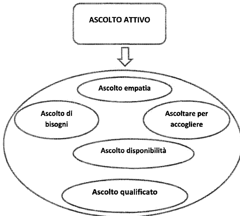
Figura 1. Gli elementi dell'ascolto nei progetti: dall'ascolto qualificato all'ascolto attivo

Si parte dunque dall'ascolto qualificato, che è già ricco di elementi significativi, poiché prevede un certo bagaglio di competenze e consapevolezze del quale deve poter disporre l'adulto che si mette in relazione con un bambino/adolescente. A questo seguono vari tipi di ascolto, che si inseriscono in momenti o situazioni diverse.