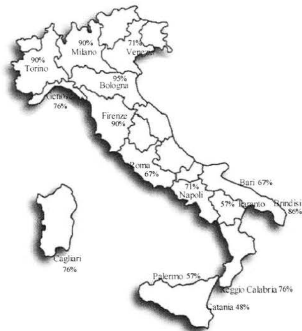
Figura 1. Percentuale di risposta agli indicatori proposti per città riservataria. Anno 2012