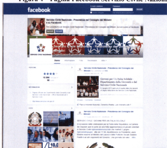
Figura 4 – Pagina Facebook Servizio Civile Nazionale

Anche l'anno 2014 ha confermato il trend degli anni precedenti, segnando una significativa crescita del gradimento della pagina Facebook ( Figura 4 ) portando, alla fine dell'anno, a sfiorare i 10.000 “mi piace”.