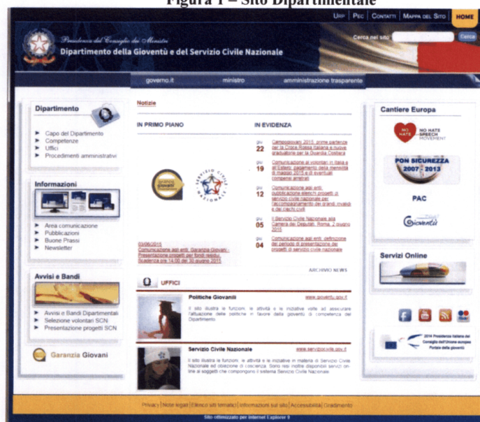
Figura 1 – Sito Dipartimentale

Il sito www.gioventuserviziocivilenazionale.gov.it (Figura 1) è stato completamente ridisegnato e dotato di una struttura completamente innovativa; ciò al fine di connotarlo come “porta di ingresso” a tutte le attività in cui è impegnato il dipartimento. La sezione notizie è stata unificata e sono state trasferite su tale sito tutte le sezioni di interesse generale del dipartimento, mentre per le informazioni specifiche in materia di politiche giovanili e servizio civile nazionale vi è il rimando ai due siti tematici www.gioventu.gov.it e www.serviziocivile.gov.it (Figura 2 e Figura 3)