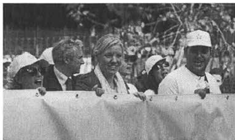
Il Ministro Josefa Idem al corteo che si è recato sotto l'albero Falcone

A piazza Magione, nel salone della Basilica della Magione, si è svolta una tavola rotonda dal