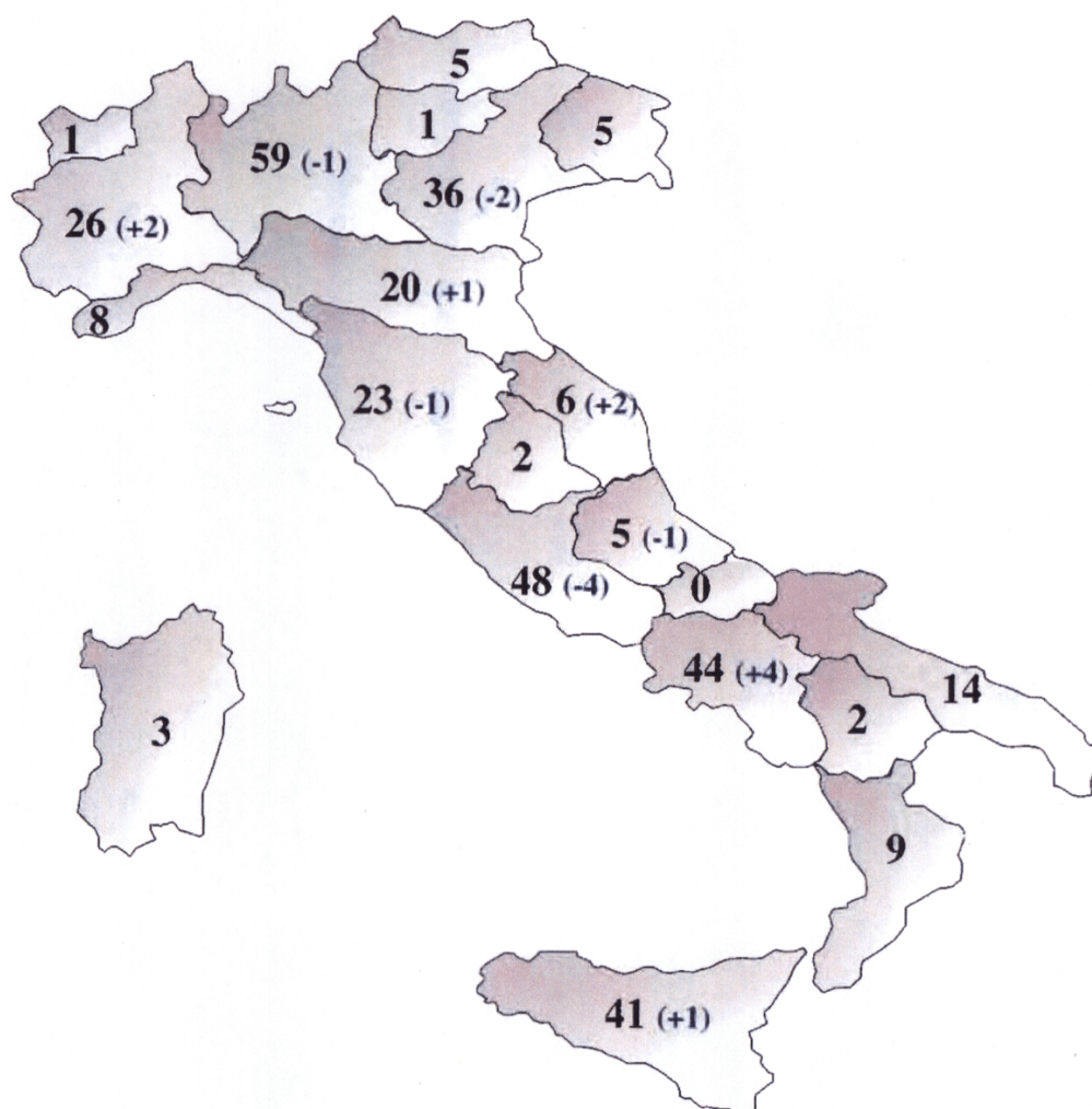
Figura 3.35: Distribuzione regionale dei centri (I, II e III Livello) che applicano tecniche di PMA alla data del 31 gennaio 2014 – TOTALE 358 (tra parentesi è indicata la differenza rispetto alla numerosità dei centri attivi al 31 Gennaio 2013)

Nella Figura 3.36 viene mostrata la numerosità, in ciascuna Regione sia di tutti i 198 centri che svolgono attività di secondo e terzo livello, dei quali 91 operano in regime pubblico o privato convenzionato con il SSN.