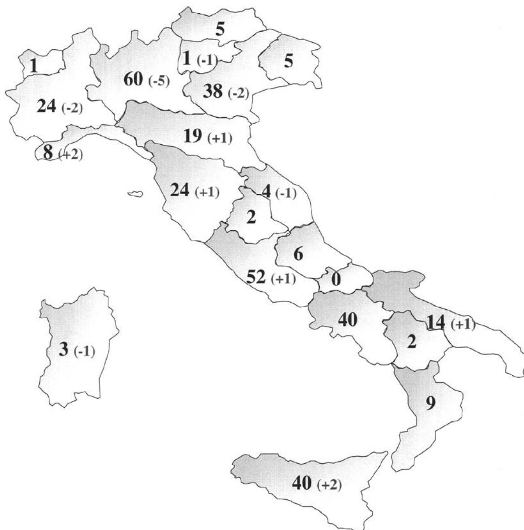
Figura 3.40: Distribuzione regionale dei centri (I, II e III Livello) che applicano tecniche di PMA – TOTALE 357 (tra parentesi è indicata la differenza rispetto alla numerosità dei centri attivi al 31 Gennaio 2012).

Nella Figura 3.41 viene mostrata la numerosità, in ciascuna regione geografica di tutti i 200 centri che svolgono attività di secondo e terzo livello, dei quali 98 operano in regime pubblico o privato convenzionato con il SSN.