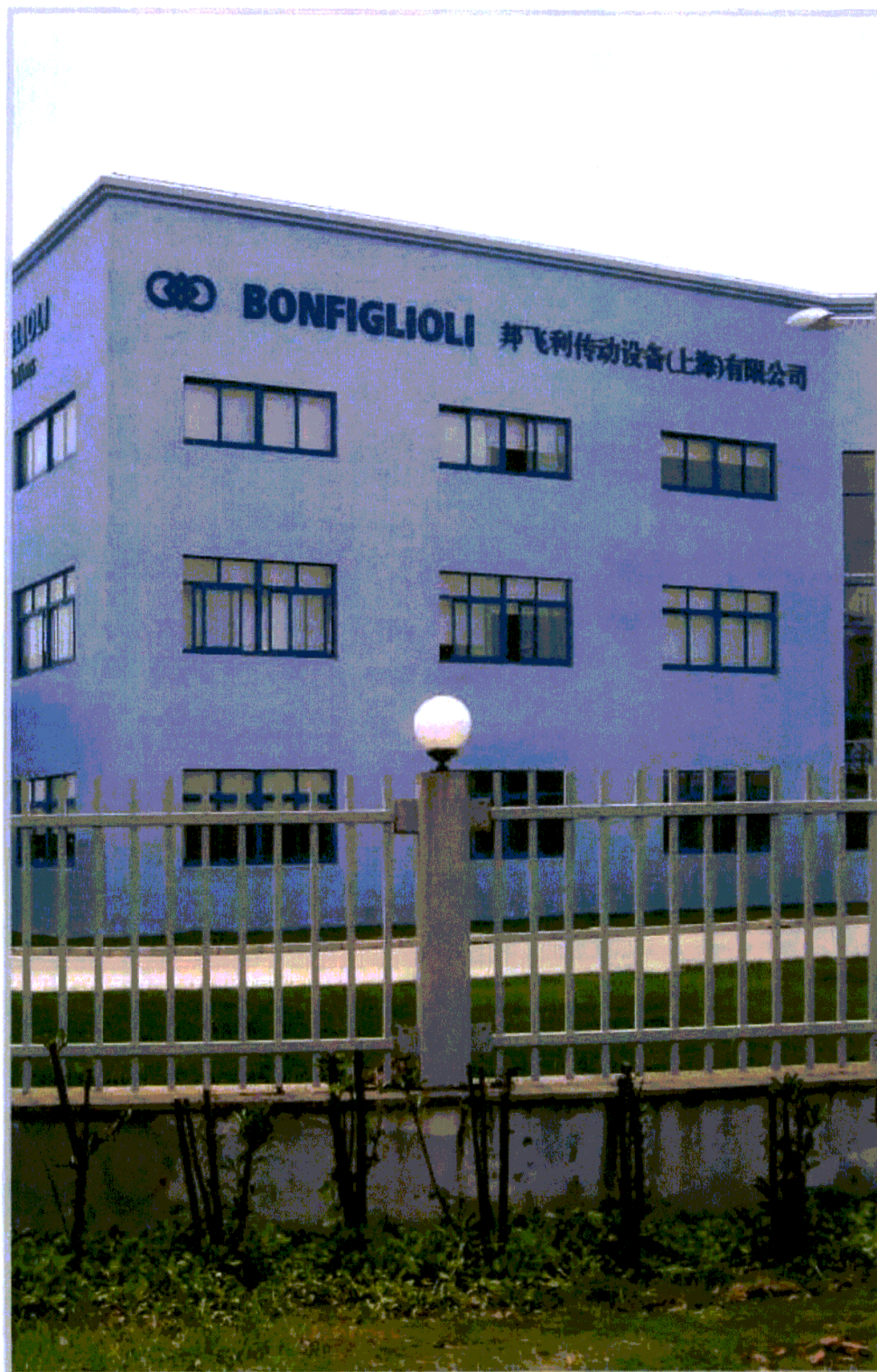
> Bonfiglioli Riduttori S.p.A. - Cina