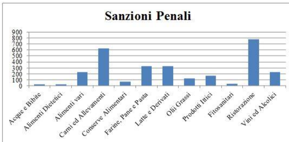
Figura 23 - sanzioni penali rilevate nei settori del PNI, suddivise in sottosectori