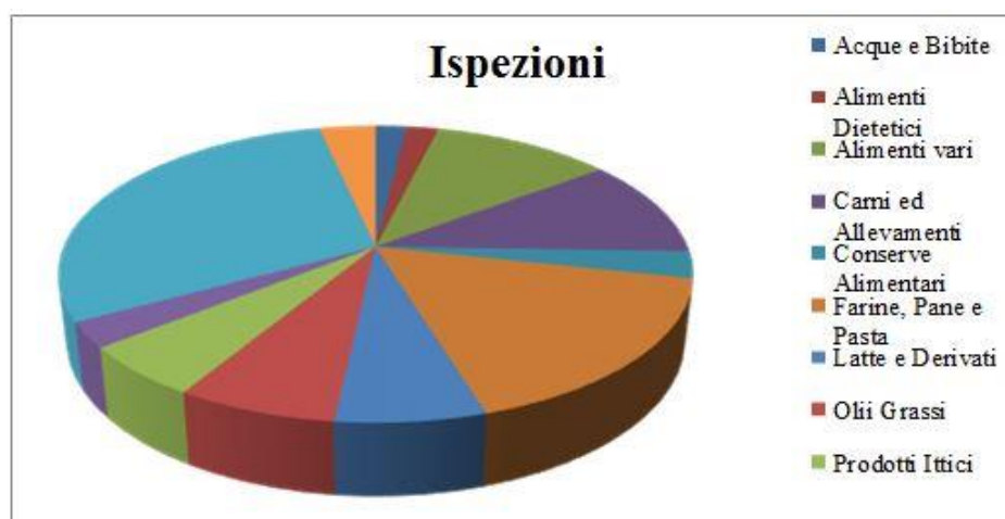
Figura 21 - ispezioni nei settori del PNI