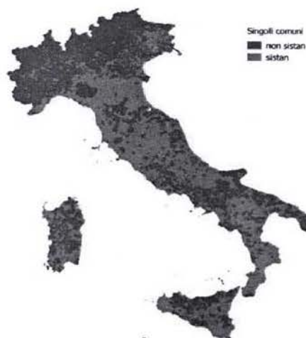
Figura 2 - Amministrazioni comunali con uffici di statistica appartenenti al Sistan (compresi i Comuni in associazione) – Anno 2014