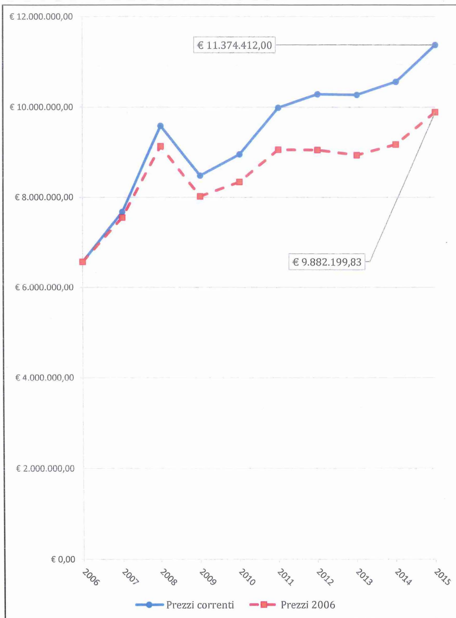
Figura 5.1 FUS – Attività di danza: andamento dello stanziamento (euro a prezzi correnti e costanti*) (2006-2015)

Fonte: Elaborazione Osservatorio dello Spettacolo su dati Direzione Generale Spettacolo e su dati ISTAT *Per il calcolo dei valori a prezzi costanti si è utilizzato l'indice nazionale dei prezzi al consumo per le famiglie di operai e impiegati al netto dei tabacchi (FOI(nt))