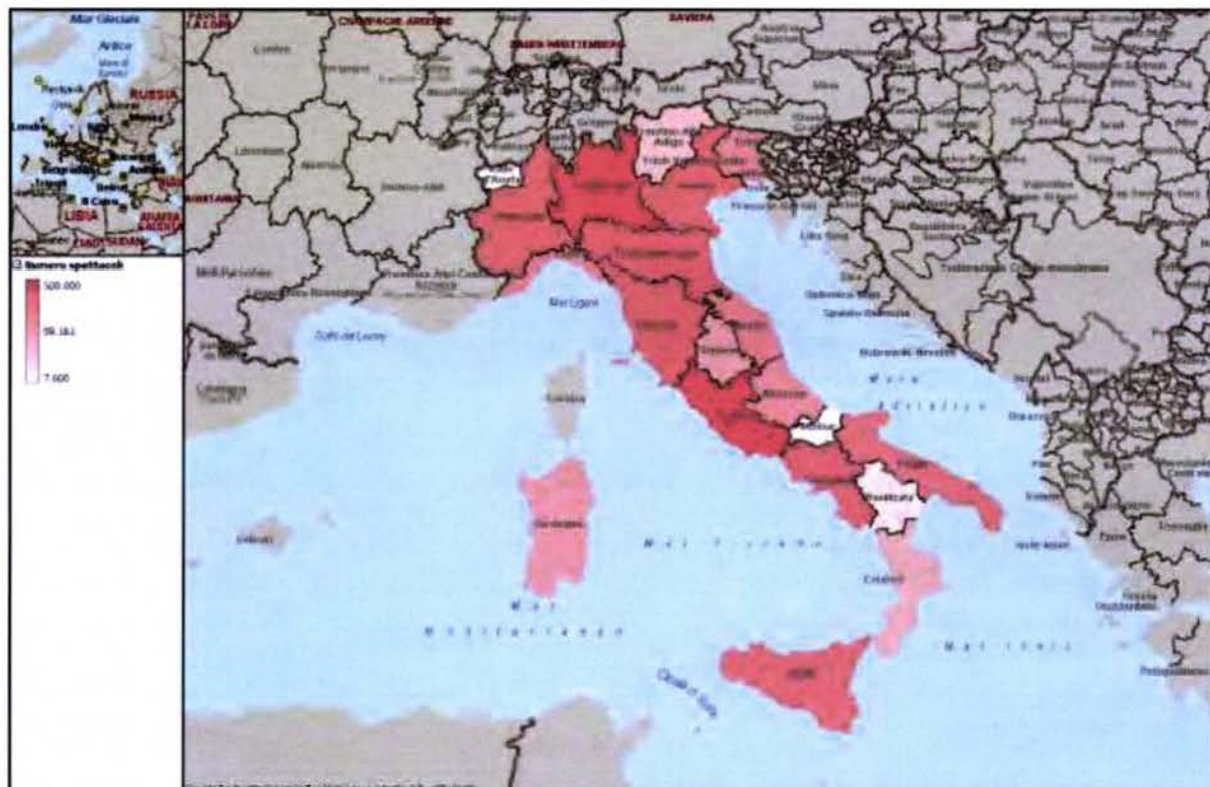
Figura 8.10 Italia - Attività di spettacolo dal vivo* e attività cinematografica: ripartizione del numero di spettacoli per regione (2014)