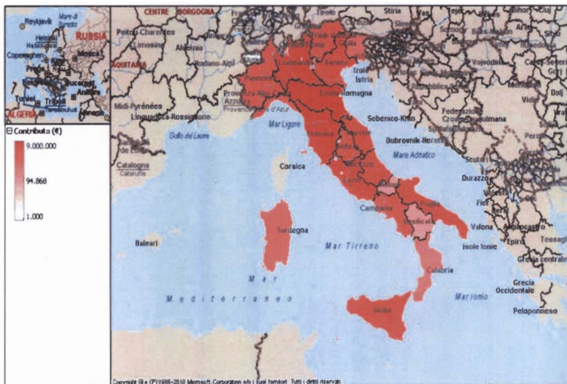
Figura 3 FUS - Attività musicali: ripartizione del contributo assegnato* per regione** (2013)