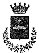
Città di Orbassano

L'Amministrazione comunale ha partecipato al "Progetto Acqua per la Farm di Gatunga – Kenya" realizzato dalla ONG COL'OR Onlus, che mira al miglioramento delle condizioni di vita di circa 800 famiglie dei villaggi della Diocesi di Meru afferenti alla Parrocchia di Gatunga, attraverso la costruzione di un pozzo che permetterà lo stoccaggio di parte dell'acqua per l'allevamento e la realizzazione di una rete idrica per le colture. In particolare, nell'autunno 2015 sono stati realizzati uno scavo, la posa di alcune tubazioni ed un meccanismo per il pompaggio manuale dell'acqua.