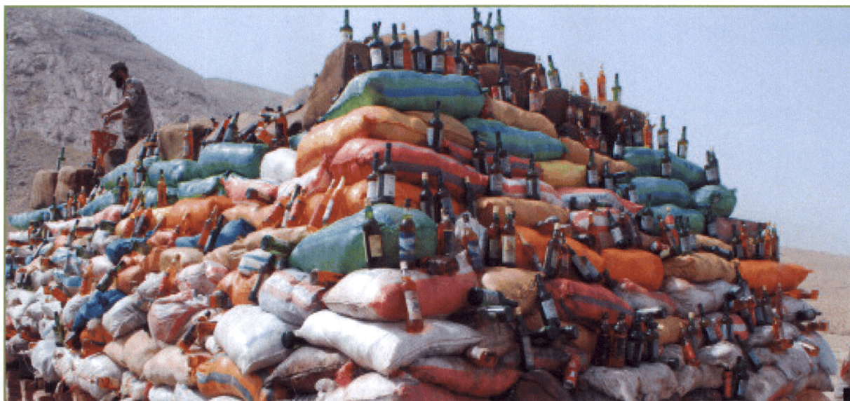
Pakistan - Quetta, preparazione di pila per incenerire lo stupefacente sequestrato

hanno fatto crollare la locale produzione a 3.700 tonnellate (con un calo del 36 per cento rispetto al 2011). Tuttavia tale Paese, con il suo 74 per cento, rimane di gran lunga il principale produttore di oppio a livello mondiale.