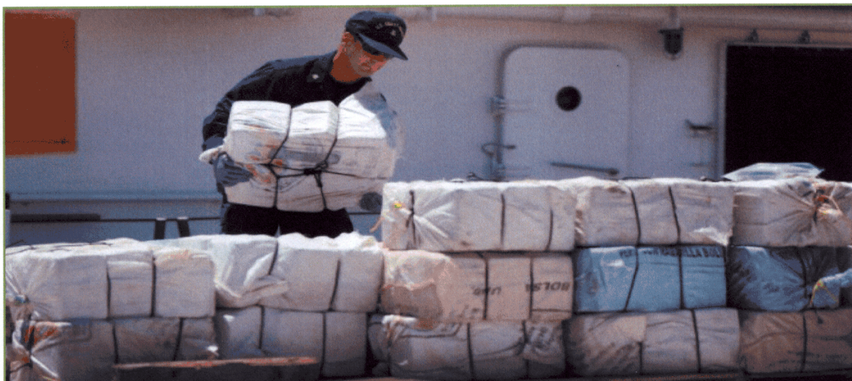
Mar dei Caraibi - Sequestro di 998 kg di cocaina da parte della Guardia Costiera degli U.S.A.

Faso, Costa d'Avorio, Marocco, Ghana e Togo.