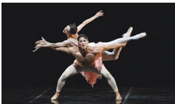
Gala des Étoiles