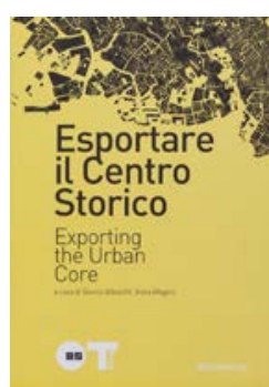
Esportare il Centro Storico Rubettino