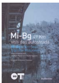
Mi-Bg 49 Km visti dall'autostrada Rubettino