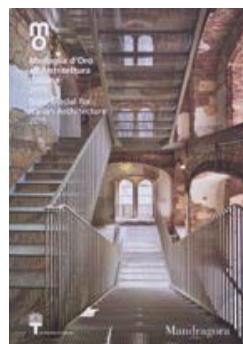
Medaglia d'Oro all'Architettura Italiana 2015 Mandragora