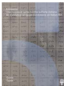
Ennesima Mousse Publishing