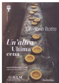
Gregorio Botta Un'altra Ultima cena Rubettino