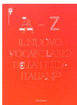
Il nuovo vocabolario della moda Italiana Mandragora