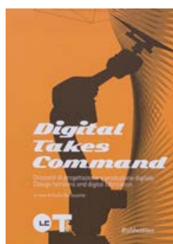
Digital Takes Command Rubettino