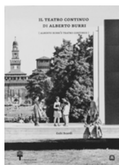
Il Teatro Continuo di Alberto Burri Corraini Edizioni