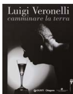
Luigi Veronelli Camminare la terra Giunti