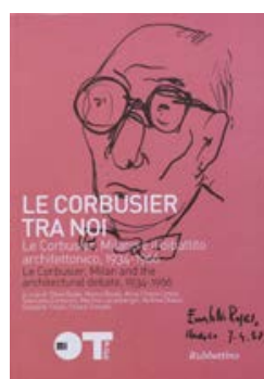
Le Corbusier tra noi Rubettino