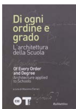
Di ogni ordine e grado L'architettura della Scuola Rubettino