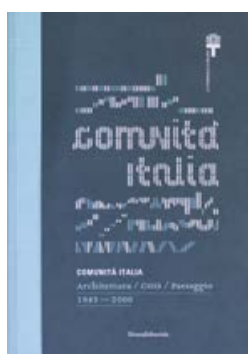
Comunità Italia Silvana Editoriale