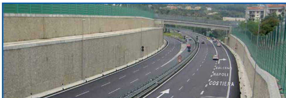
■ Autostrada A3 Salerno-Reggio Calabria - Svincolo Salerno Fratte

Ai sensi dell'art. 2427-bis si precisa che la società non ha posto in essere operazioni in strumenti finanziari derivati e non vi sono immobilizzazioni finanziarie diverse dalle partecipazioni di controllo e di collegamento iscritte a un valore superiore al loro fair value.