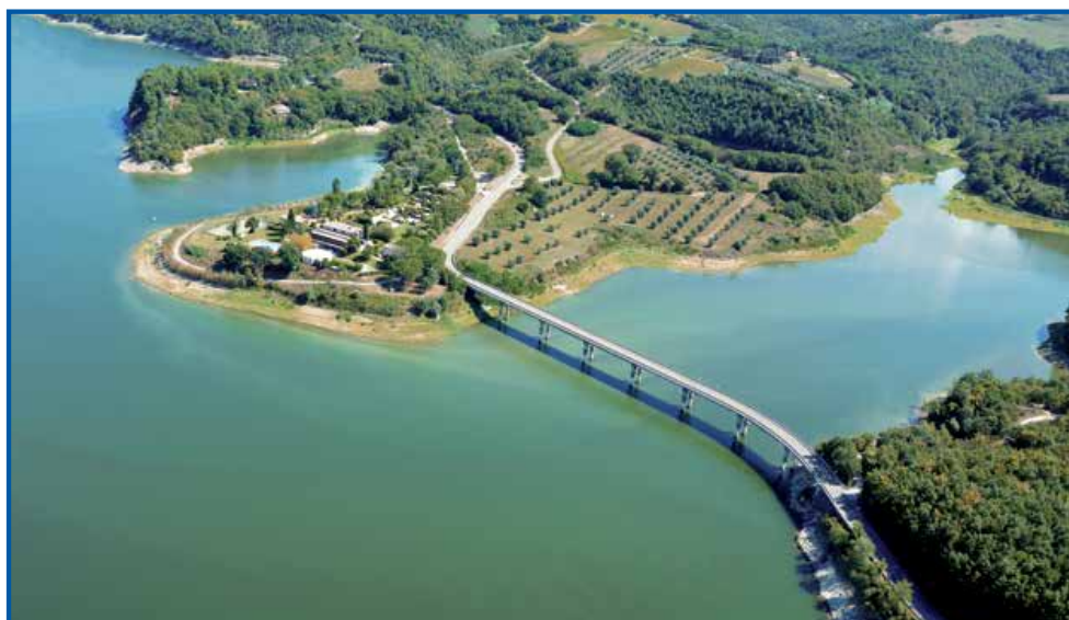
■ S.S.448 "di Baschi"