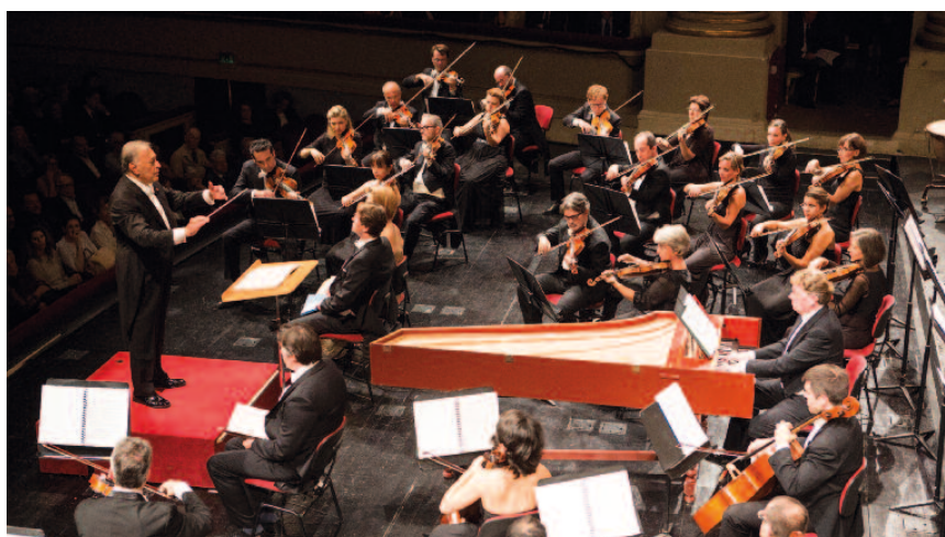
Filarmonica della Scala (29 settembre 2014) Direttore Zubin Mehta