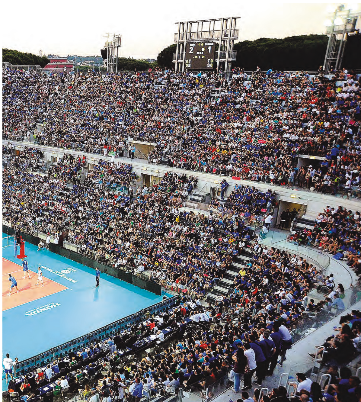
Parco del Foro Italico di Roma: Centrale del Tennis, World League Italia – Polonia, giugno 2014