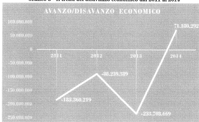
Grafico 3 - Il trend del disavanzo economico dal 2011 al 2014

Il valore della produzione, pari ad euro 589,8 milioni di euro, comprende, principalmente, i trasferimenti da parte dello Stato (573,9 milioni di euro) 26 , e in misura minore i trasferimenti da parte di Istituti diversi dallo Stato (euro 13,1 milioni di euro) ed i proventi propri dell'Agenzia (2,8 milioni di euro), in flessione, però del 30,96 per cento rispetto al 2013.