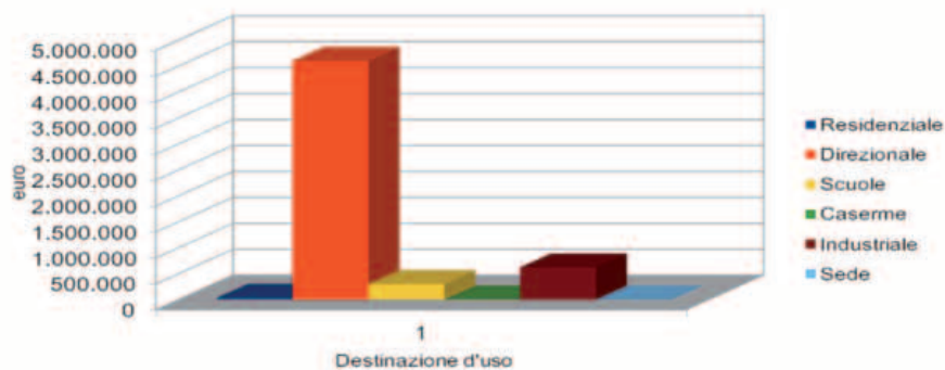
Ripartizione dei canoni di locazioni

Di seguito si rappresentano i risultati della gestione complessiva del patrimonio immobiliare: