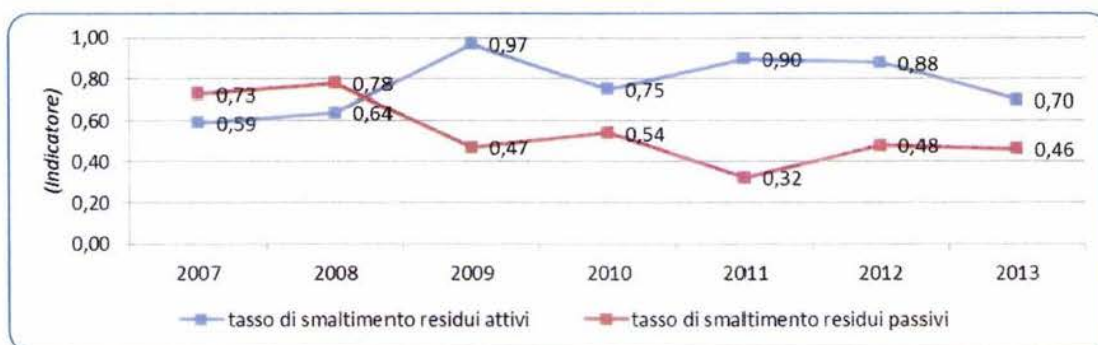
GRAFICO n. 4 - TASSO DI SMALTIMENTO DEI RESIDUI

I suddetti fenomeni sono meglio evidenziati dal grafico seguente: