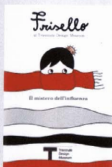
Frisello al Triennale Design Museum Il mistero dell'influenza Triennale Design Museum