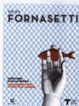
Piero Fornasetti Cento anni di follia pratica Corraini Edizioni