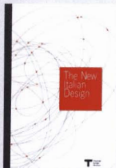
The New Italian Design Triennale di Milano