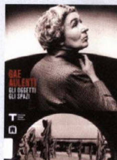
Gae Aulenti Gli oggetti gli spazi Corraini Edizioni