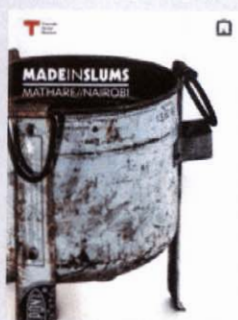
Made in Slums: Mathare/Nairobi Corraini Edizioni