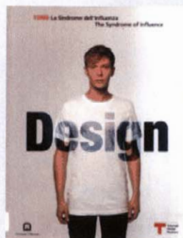
TDM6: La Sindrome dell'Influenza Corraini Edizioni