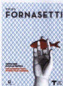
Piero Fornasetti Cento anni di follia pratica Corraini Edizioni