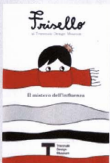
Frisello al Triennale Design Museum Il mistero dell'influenza Triennale Design Museum