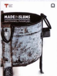
Made in Slums: Mathare/Nairobi Corraini Edizioni