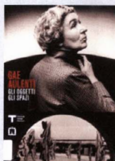
Gae Aulenti Gli oggetti gli spazi Corraini Edizioni