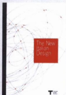
The New Italian Design Triennale di Milano