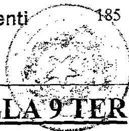
TABELLA 9 TER