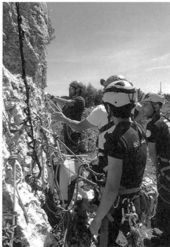
Corso di introduzione al torrentismo.