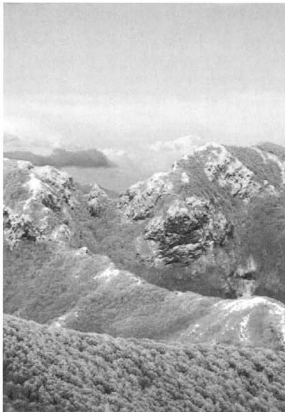
Acellica, Parco Regionale monti Picentini.