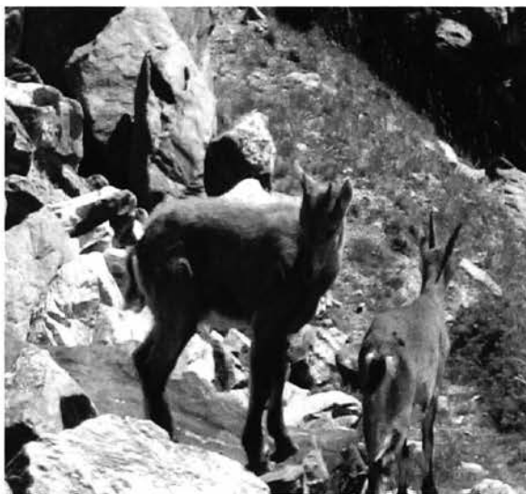
Giovani esemplari di stambecchi.

Concentra la propria attività nella promozione di comportamenti positivi e conservazionistici e di progetti educativi. Inoltre, ha lo scopo di sostenere e promuovere attività che portano ad un miglioramento delle pratiche di turismo in montagna, contribuendo