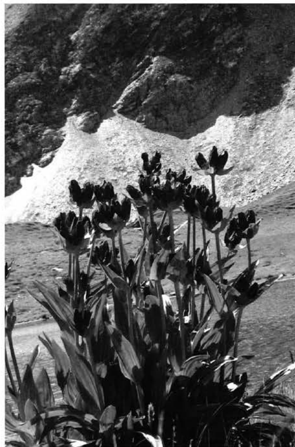
Flora alpina: genziana rossa.

Il prossimo incontro avverrà a Parigi il 12 settembre 2014 in concomitanza al convegno del CAA.