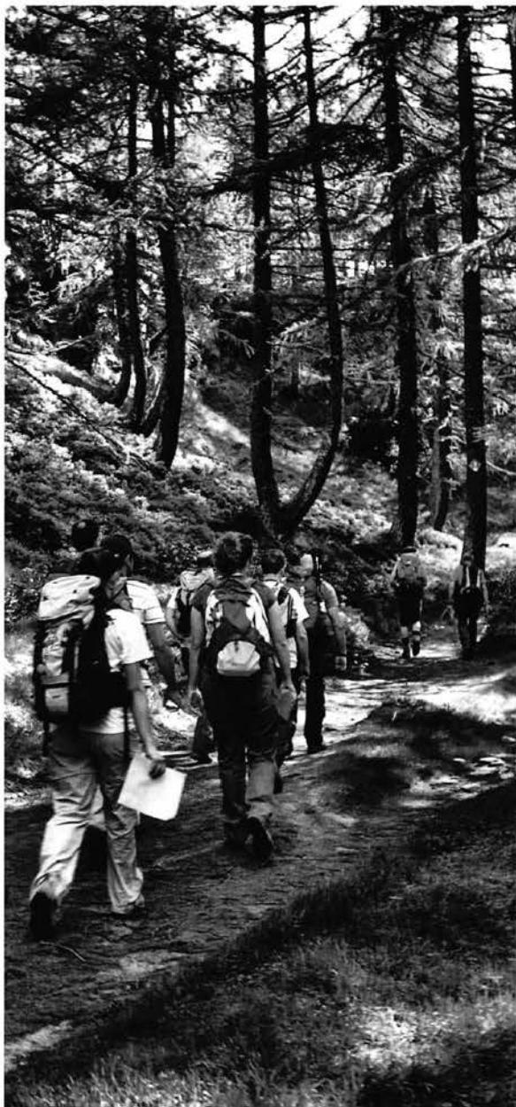
Giovani in escursione guidata.

Un secondo aggiornamento, ha avuto come tema la lettura del paesaggio attraverso la fotografia naturalistica, con l'obiettivo di