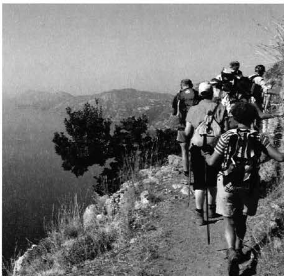
In cammino sul "Sentiero degli Dei", Costiera Amalfitana.

primaverile tenuto ad aprile a Skopje (Macedonia) è stato inserito un altro tema importante per la comprensione di ciò che spinge i giovani a frequentare la montagna: "Inspire youth into mountaineering" (ispirare i ragazzi all'alpinismo), anch'esso sostenuto e promosso dal CAI durante la riunione YC di Bergamo, al fine di trovare nuove strade per avvicinare i giovani alla montagna