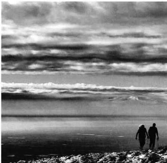
In cresta, verso la cima del Monte Bronzone, Vigolo.