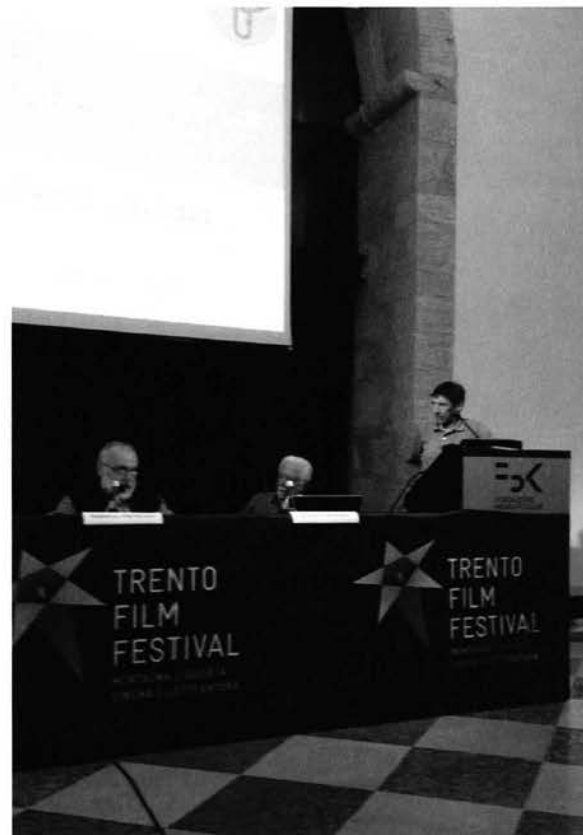
Un'immagine del convegno CSMT tenutosi a Trento il 4 maggio 2013.