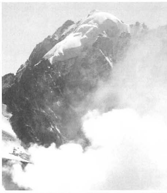
Aiguille Vert parete Nord.

Nell'anno 2013 si stima per difetto un impegno di 200 giornate/persona per realizzare e mettere in forma scritta una parte della manualistica prevista e per la realizzazione dei DVD.