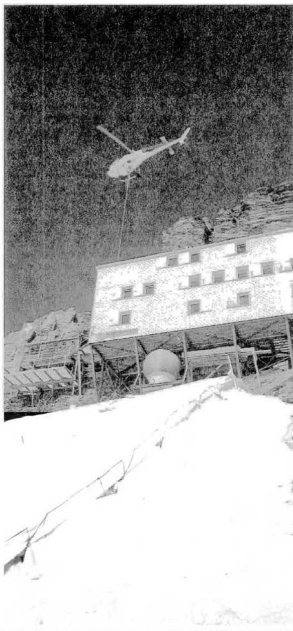
Mönchjochütte, Gruppo della Jungfrau.