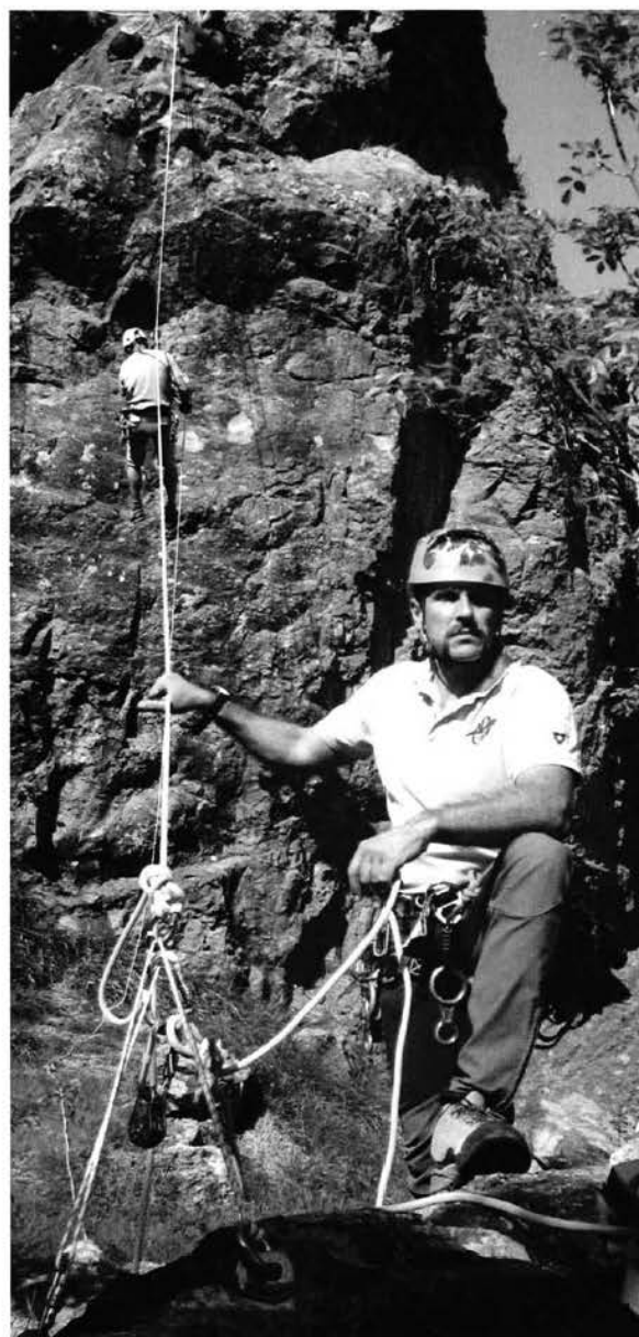
Aggiornamento per istruttori di torrentismo in Liguria.

Questa commissione che ora termina il suo mandato augura ai nuovi entrati di proseguire il lavoro e migliorare per un CAI più grande per tutti.