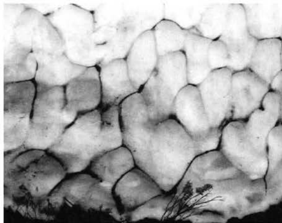
Pagine di neve.