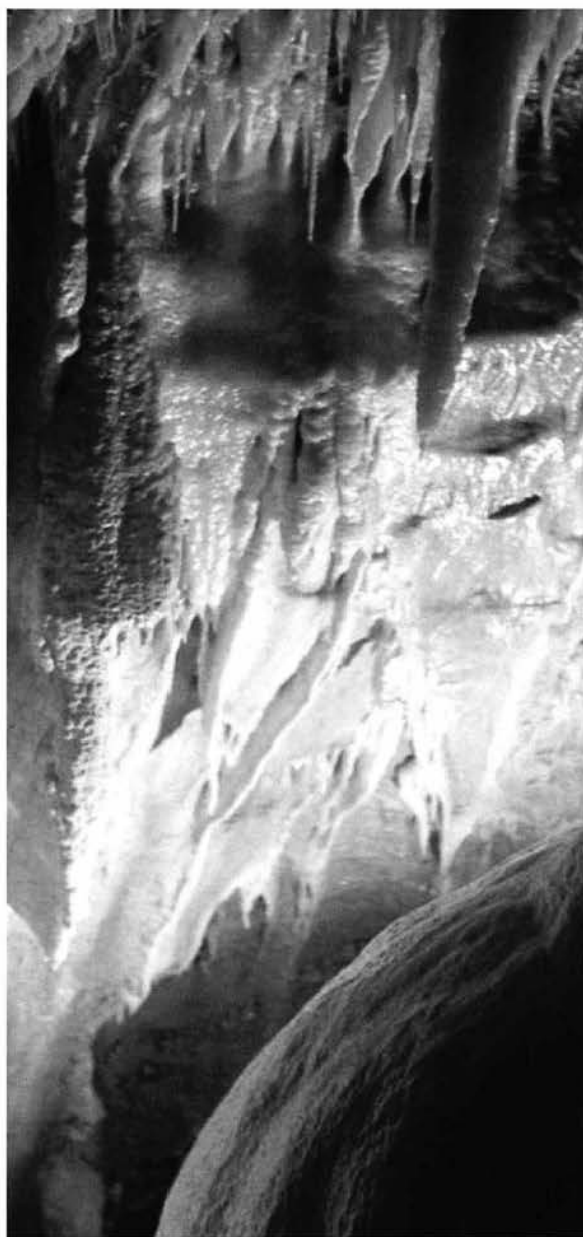
La Sala dei Cristalli.