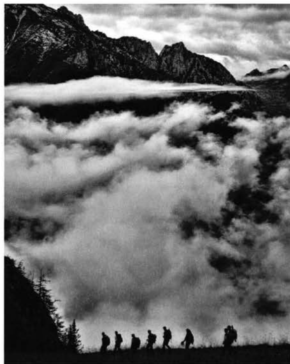
Escursionisti in cammino.

L'attività delle Commissioni Interregionali ha richiesto un impegno di circa 500 giornate/persona mentre gli istruttori delle scuole interregionali per l'organizzazione dei moduli e la partecipazione ai vari corsi si sono dedicati per 1500 giornate/persona.