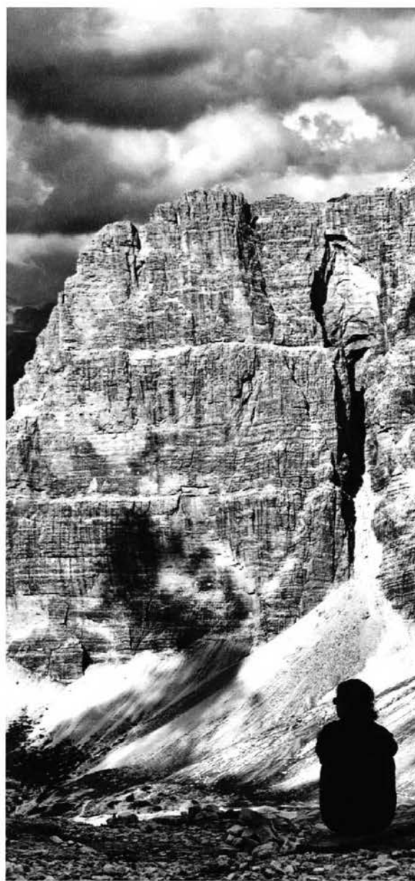
Cima Scotoni, Gruppo di Fanis.