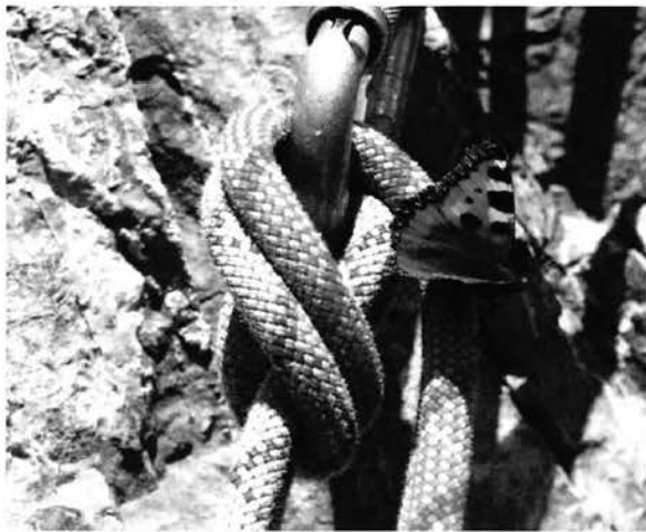
Sosta in arrampicata.

Il CAI è protagonista, attraverso il Corpo Nazionale del Soccorso Alpino e Speleologico, di delicate operazioni di soccorso in ambiente ipogeo od ipogeo-assimilabile (nel caso di catastrofi naturali quali terremoti e simili).