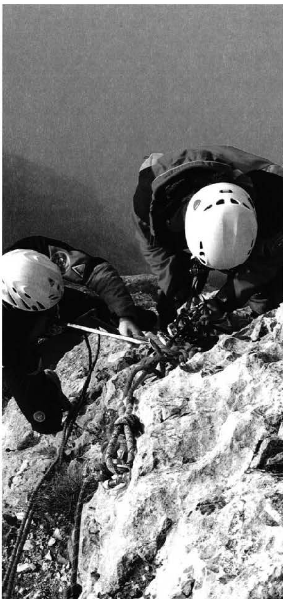
Corso TS Trentino 2005.