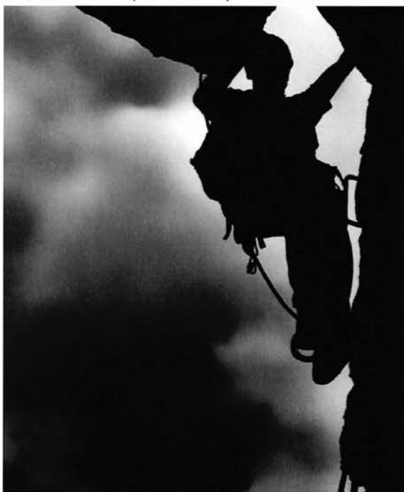
Suggestiva immagine in parete.

Ottobre - Pedra Longa (Sardegna) - Nuova via per Maurizio Oviglia, Cecilia Marchi e Giorgio Caddeo su questo faraglione, dopo 30 anni di black out di aperture. 190 m e difficoltà sino al 6a+, chiodatura completamente a spit ma realizzata dal basso.