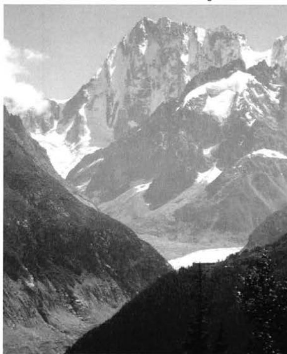
Grandes Jorasses parete Nord