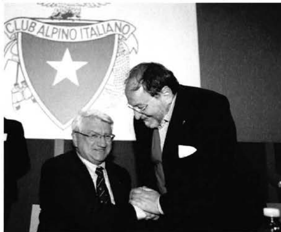
Assemblea dei Delegati 2013.