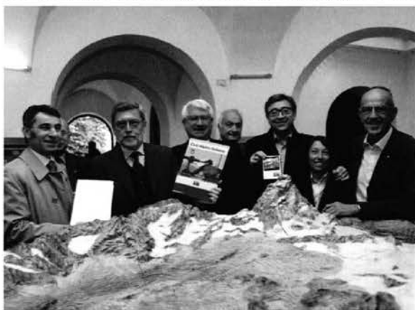
Assemblea dei Delegati 2013.