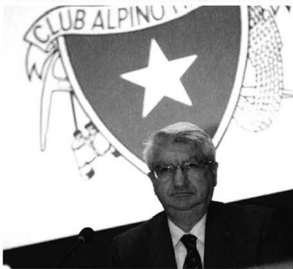
Assemblea dei Delegati 2013.