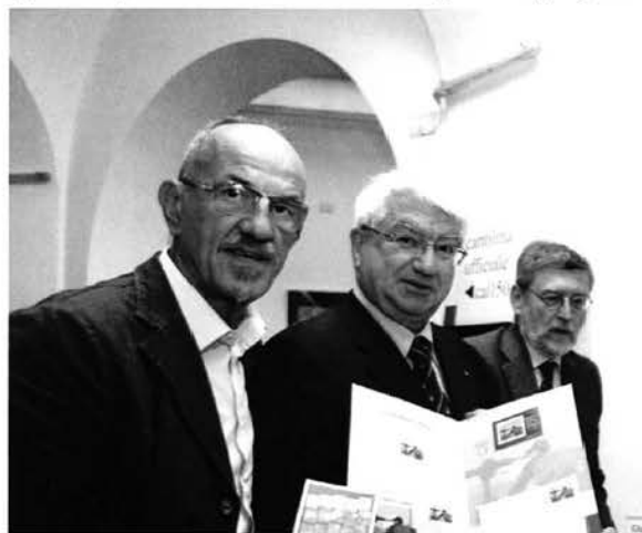
Assemblea dei Delegati 2013.