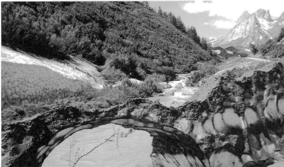
Arco di ghiaccio in Val Veny.

Notizie su Facebook Pagina CAI 150: 695 Notizie su Facebook pagina Montagne360: 726 Notizie su Twitter CAI 150: 965 Notizie su Twitter Montagne360: 1098.