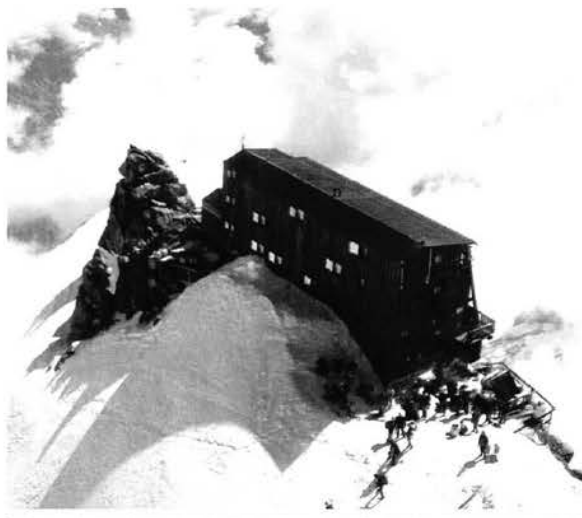
Capanna Osservatorio Regina Margherita.

Tale numero è sicuramente rappresentativo della cura e dell'amore verso il patrimonio sociale, ed anche verso l'ambiente, che sono alla base delle Sezioni CAI.