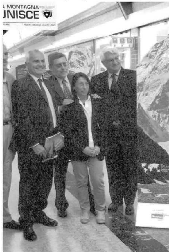
La montagna unisce, anche al centro Auchan di Torino.

A tal fine mi preme sottolineare che la "conoscenza della montagna" è uno degli scopi statutari dichiarati, quindi la