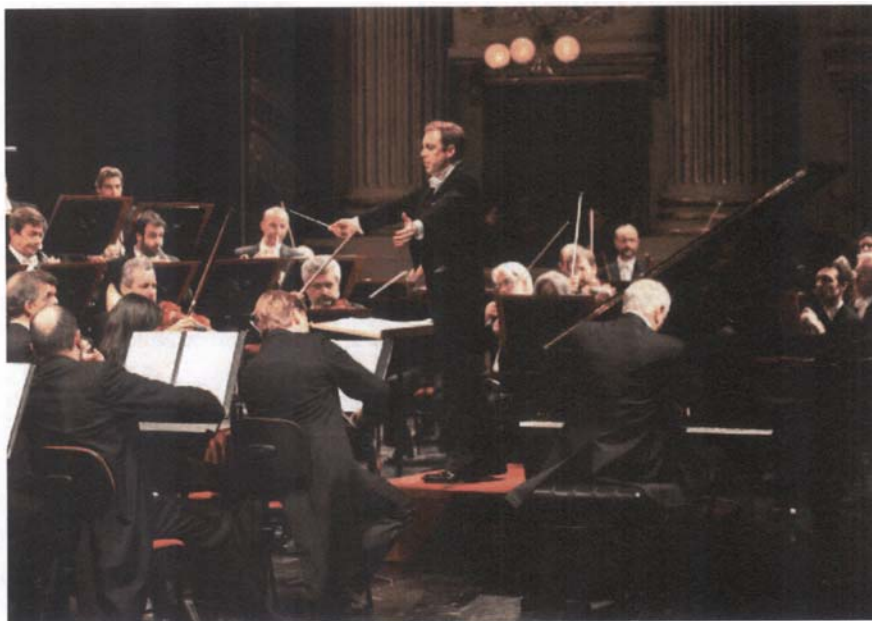
Filarmonica della Scala (7 novembre 2012) Direttore Daniel Harding Pianoforte Daniel Barenboim

Il decremento rispetto al 2011 degli acquisti di materie prime è dovuto alla diversa programmazione artistica presentata nel corso del 2012.