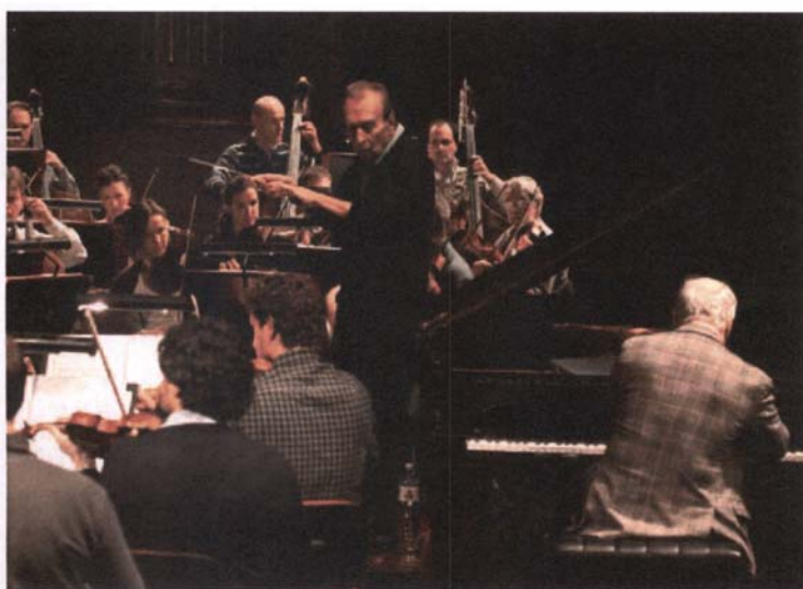
Filarmonica della Scala Orchestra Mozart (30 ottobre 2012) Direttore Claudio Abbado Pianoforte Daniel Barenboim

I “Proventi per la vendita di biglietti e abbonamenti” ammontano a 30.213 migliaia di €, dopo aver riscontato ricavi relativi alle vendite d'abbonamenti per la stagione 2012-2013 per un importo di 11.772 migliaia di €, rispetto a 10.612 migliaia di € dell'esercizio 2011.