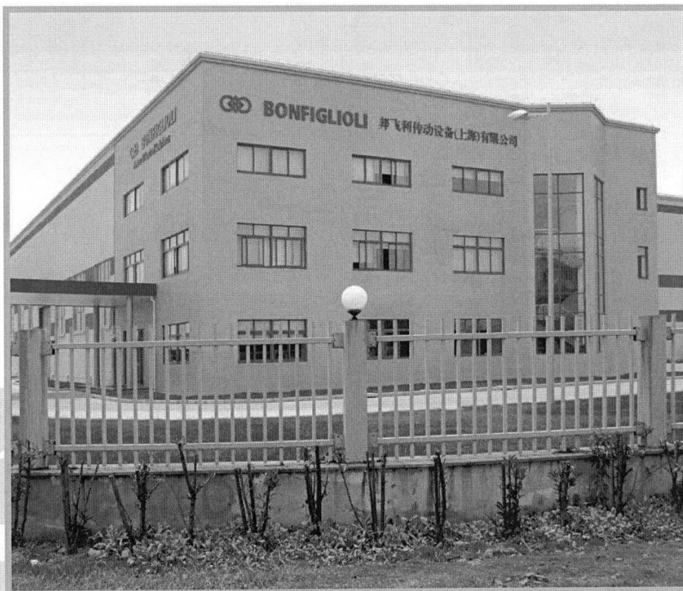
> Bonfiglioli Riduttori S.p.A. - Cina