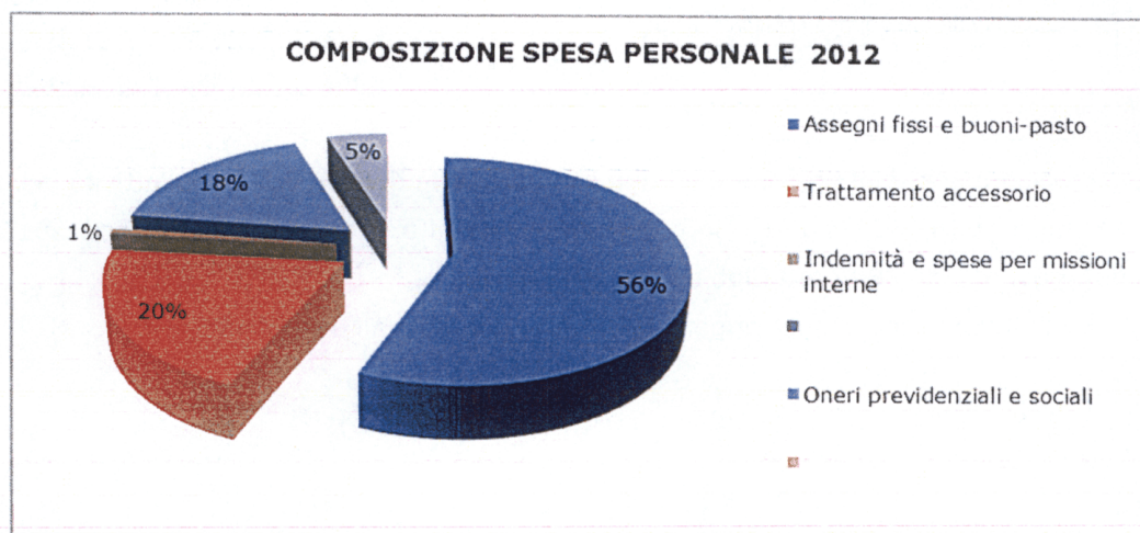
Tabella costruita con i dati della contabilità finanziaria ad eccezione della voce "Accantonamento fondo liquidazione" tratta dal conto economico

In ottemperanza al Regolamento per l'Amministrazione e la Contabilità degli Enti Pubblici, di cui alla legge n. 70 del 1975 e al D.P.R. 97/2003, la gestione è articolata per centri di costo.