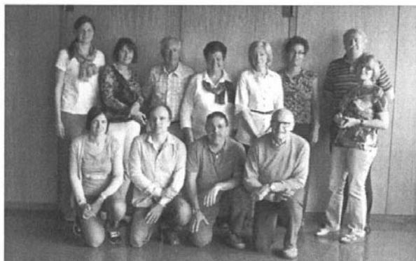
Quest'anno è stato il Club Alpino Italiano ad ospitare, a Brunico (BZ), la riunione della Commissione CAA Protezione e Natura.

Assente giustificato LAV (Liechtenstein). Il FAT (Federazione Alpinistica Ticinese), aggregata al CAS, è un nuovo aderente alla Convenzione del diritto di reciprocità, la cui adesione era stata discussa e approvata lo scorso anno. Vengono discusse ed approvate le relazioni del Presidente e del Segretario sull'esercizio corrente. Si riconfermano le attuali cariche. Rimane invariato il prezzo del bollino, che dà diritto di reciprocità ai soci dei club aggregati, in € 9,50 quello collettivo e € 40,00 quello individuale. Salvo piccolissime defezioni si constata un leggero aumento dei soci con punte del 4% nel DAV e OeAV. Si discutono alcune proposte di variazione al testo della convenzione avanzate da PZS e FEDME. Le proposte vengono accettate. Viene inoltre deciso che la lingua ufficiale sarà d'ora in poi l'inglese. Il nuovo testo approvato della convenzione sarà inviato a tutti i club aderenti. Il contributo spettante al CAI per l'anno 2011 è stato di € 171.449,90.